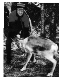
Olustvere oli otsast otsani täis jõulumaid ja jõulumaalaseid