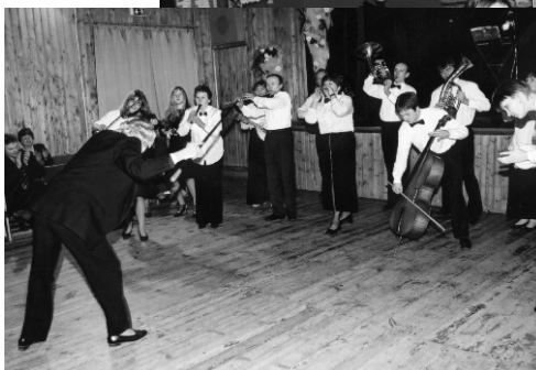
Libasümfoonikud Suure-Jaani taidlejate pool