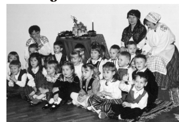
Olustvere lasteaia jõulupidu toimus rahvuslikus meeleolus