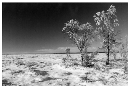
Ainult mets ja soo tukkusid vaikselt oma äsjasadanud teki all

Naabrimhed töid Suure-Jaani omavalitsetele kingiks paar saunavihta ja leilikapa, lootes, et ehk aitab see kaasa Suure-Jaani saunaulude paranemisele.