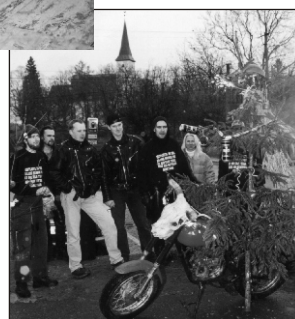
Ka selline võib olla jõulupu