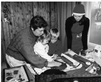
Suure-Jaani päkapikud on ametis piparkoogiküpsetamisega