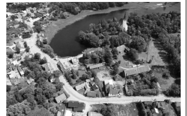
Suure-Jaani kirik ja järv