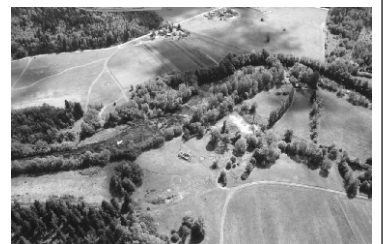
Navesti jõe käänud