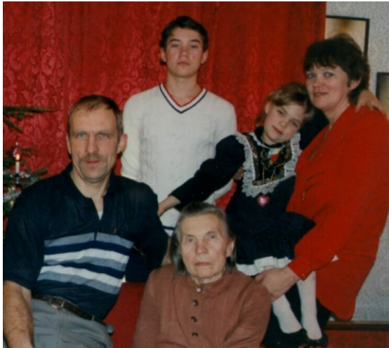
Kimmasaare kolm põlvkonda

on positiivse emotsiooni saamise nimel valmis loobuma igapäevastest mugavustest. "Elamisel maal oma talus on palju selliseid eeliseid, mille vastu linnal pole midagi pakkuda. Ma mõtlen nende all eelkõige inimese privaatsust, võimalust olla ja tegutseda omandada soovi järgi. Keegi võõras ei käivita minu akna all autot ega käi koera pissitamas. Kui soovin, pean õues maha korraliku peo suure lõkke ja mõnusa muusikaga, kartmata, et ma seejuures naabreid häiriks. Kui soovin, väljun majast ja astun metsa, jälgin loodust tema lõputus ringkäigus ja arenemises, tunnetan ennast tema osana. Laste tehtud lumememmis seisab maal õues seni, kuni kevadpäike ta sulatab, linnas pole õhtul tehtud lumememmis järgmiseks päevaks enam midagi järel." Vähemtähtis polnud kindlasti ka soov ja vajadus säilitada esiisade talu tulevastele põlvedele.