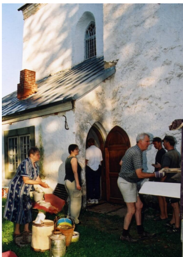
Suure-Jaani "Lions"-klubi alustas kiriku käärkambri remonti.