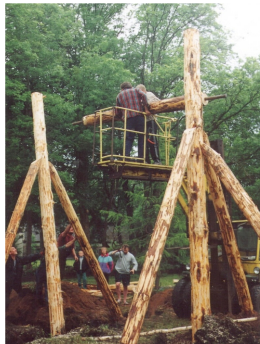
Külakiige ehitamisel on kätte jõudnud otsustav moment: kiigevõlli paigaldamine.