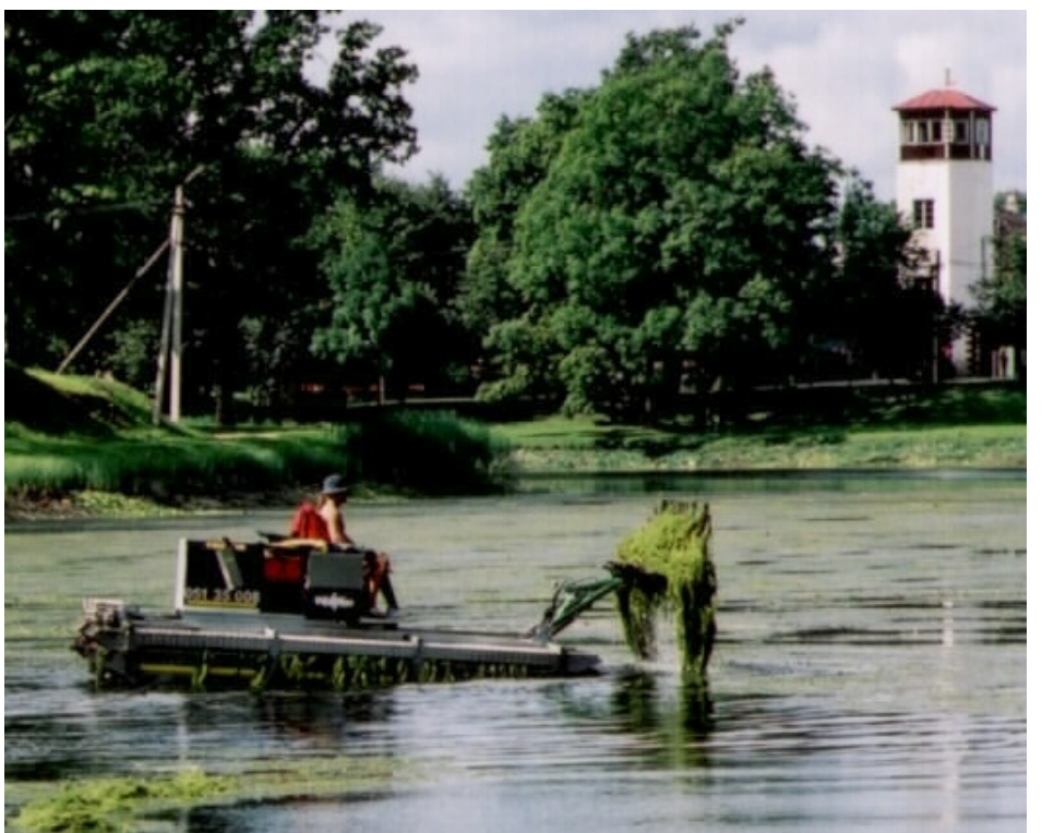
Augusti lõpupäevadel võis Suure-Jaani järvel näha isevärki veesõidukit. Tegu oli järvetaimede niidukiga. 20 000 krooni maksvat "muruniitmist" tuleks korraldada ka järgmisel aastal.