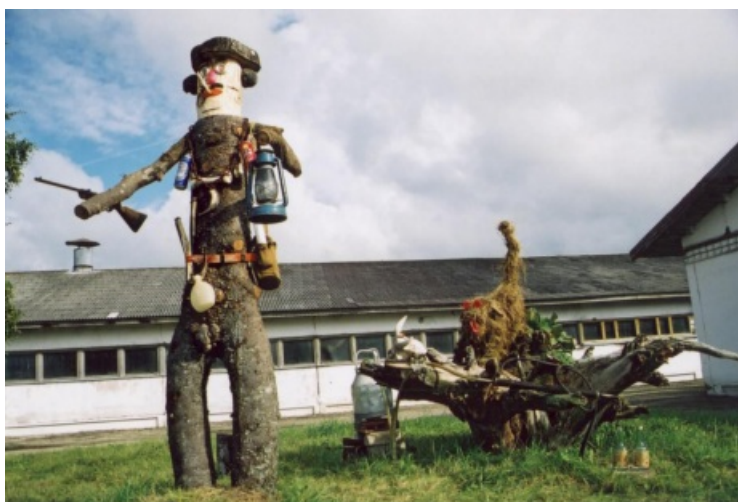
Üks auhinnatutest- Sürgavere veisefarm