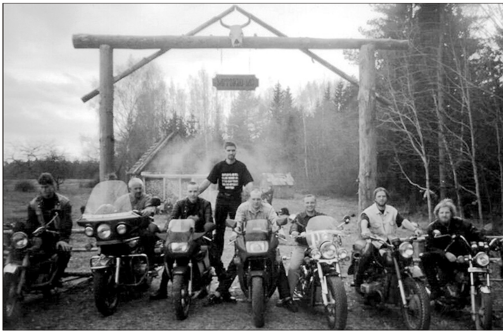
Metsikud oma maja väravas