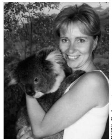
Marika Adelaide'i loomaaias 3-aastase koalalopajaga