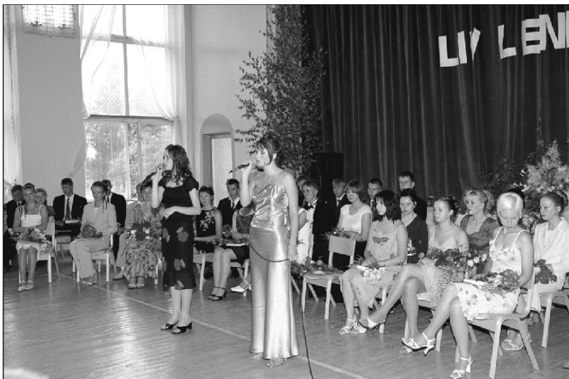
12. klassi lõpuaktus Suure-Jaani Gümnaasiumis