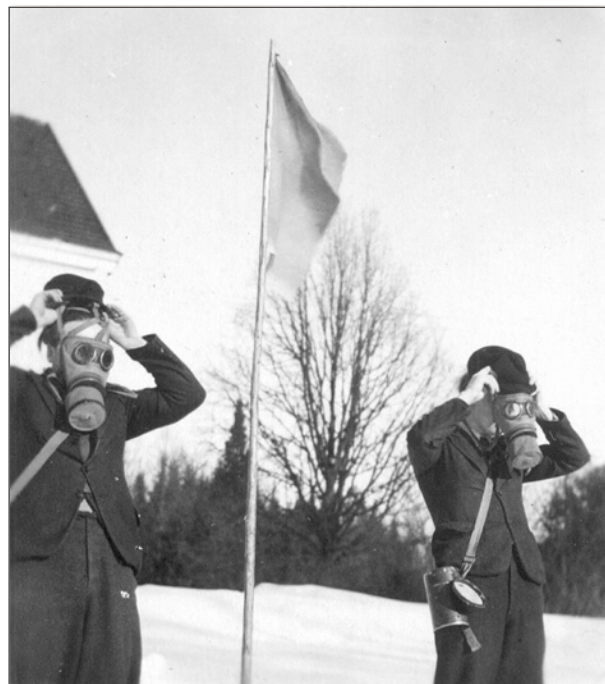
Poisid gaasikaitse õppusel