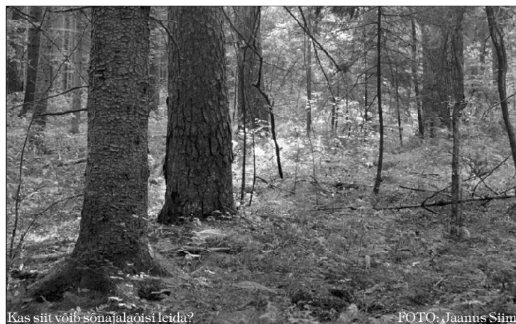
Kas siit võib sõnajalaõisi leida?