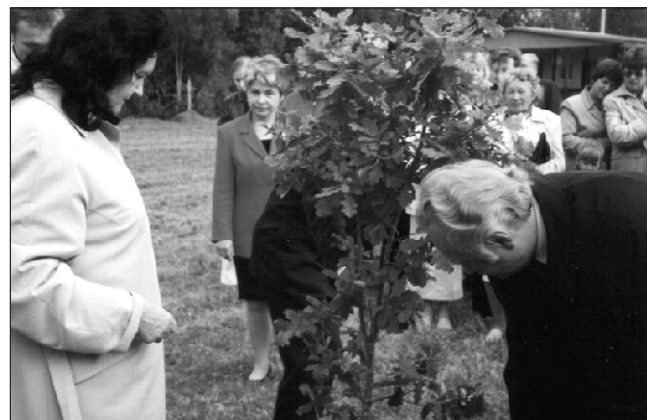
Kuhjaverelastele jääb presidendipaariga meenutama nende istutatud tamm