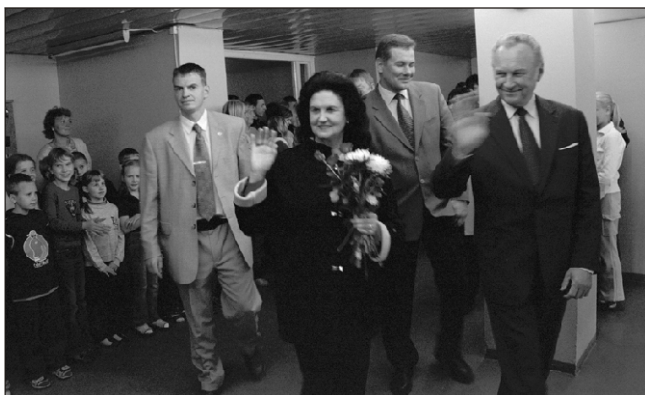
Külalised heitsid Olustveres viibides pilgu ka sealsel põhikoolile

Seejärel viis tee kõrged külalised Kuhjaverre. Külamaajuurde oli kogunenud hulk