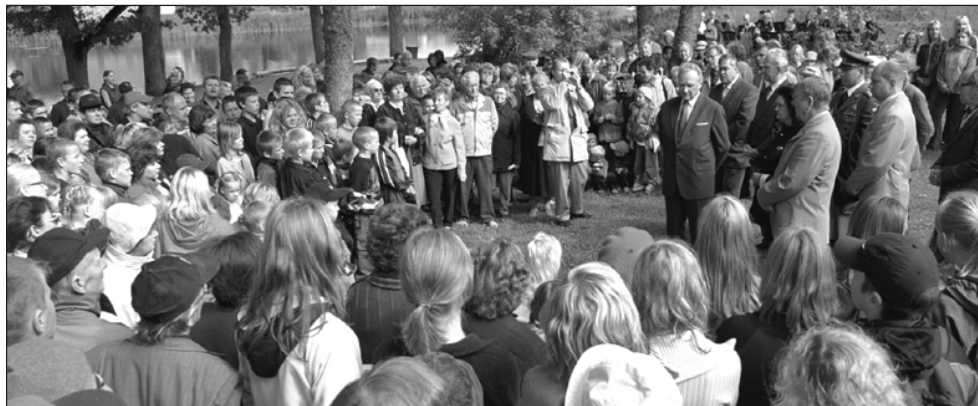
President Suure-Jaani rahvaga vestlemas