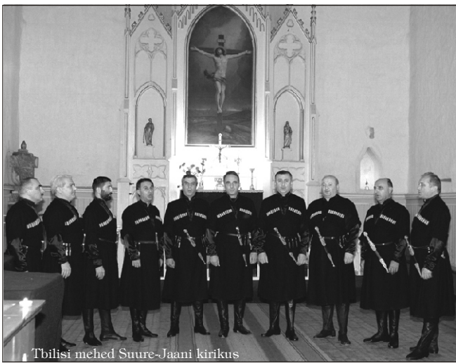
Tbilisi mehed Suure-Jaani kirikus