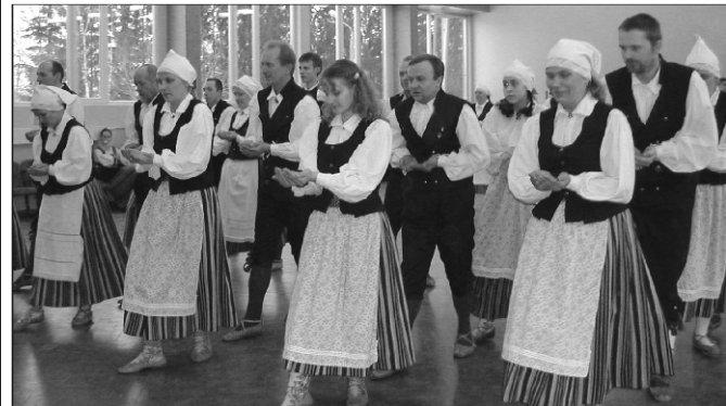
“Loits” end Viljandis Üldtantsupeo korraldajatele ette näitamas

Esimene ülevaatuuste voor on selja taga.