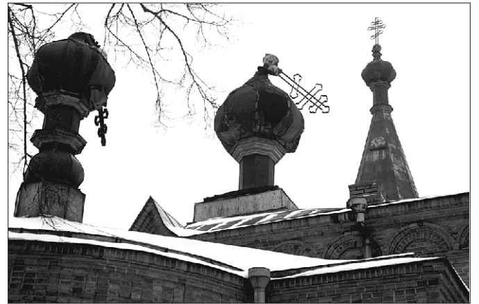
Kirik aastal 2004