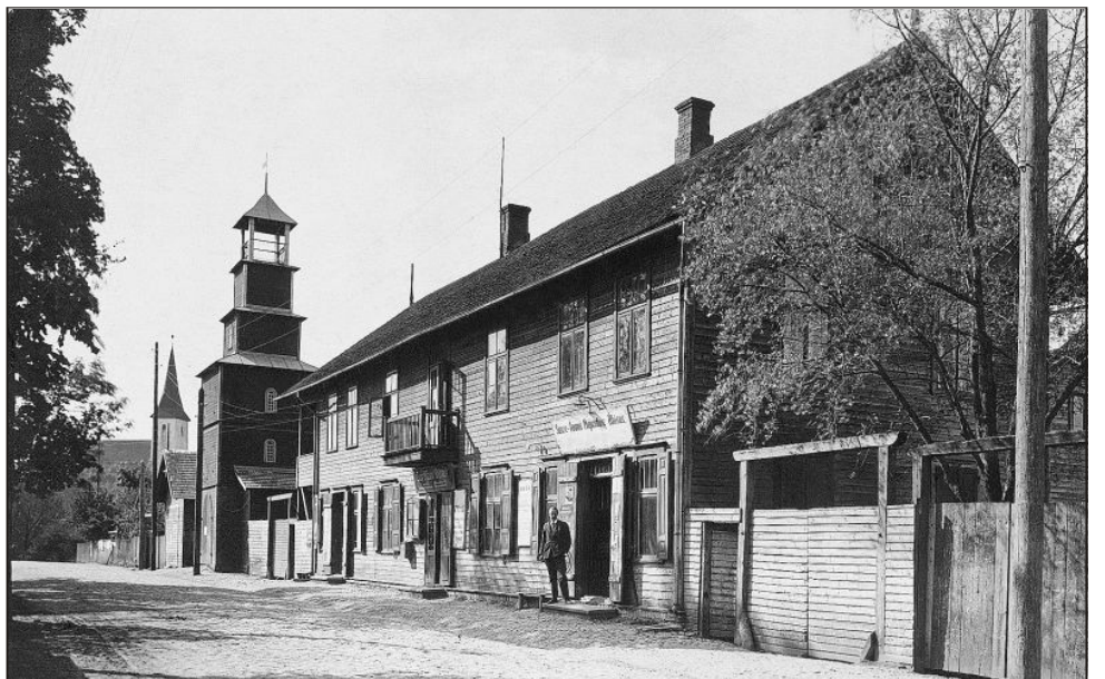
Suure-Jaani kultuurimaja (esiplaanil) 1930. aastatel