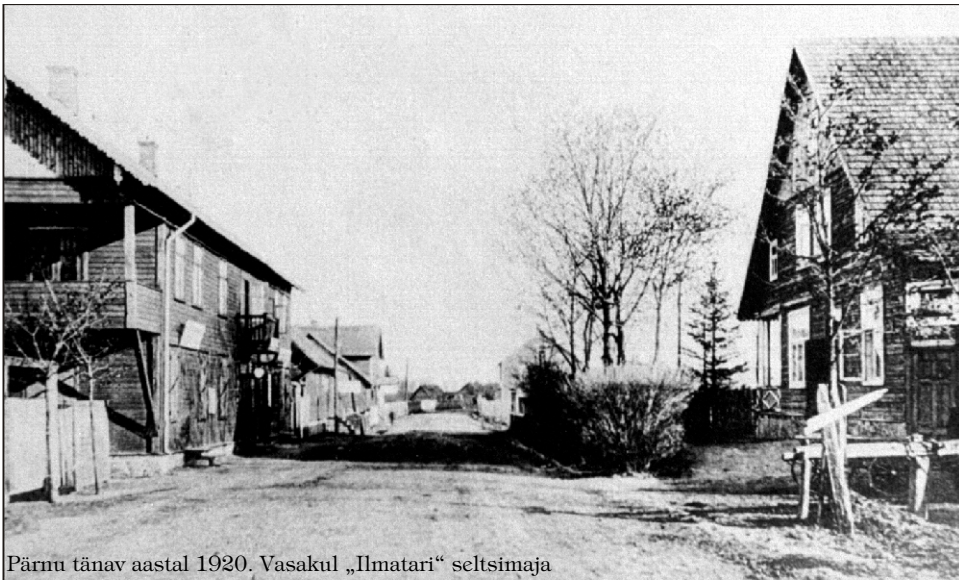
Pärnu tänav aastal 1920. Vasakul „Ilmatari“ seltsimaja