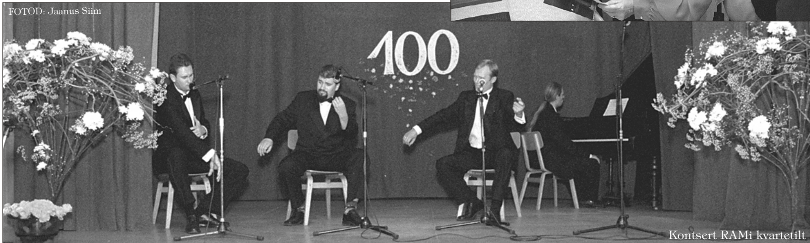
Kontsert RAMi kvartetilt