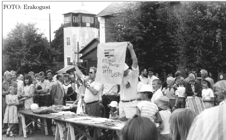
FOTO: Erakogust 1988. aasta juulis Suure-Jaani kesklinnas Muinsuskaitse Seltsi korraldatud oksjon „Lembitu“ ausamba taastamiseks