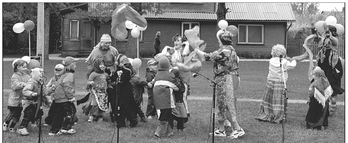
31. mail Lastes Oma Päeval Suure-Jaani lauluväljakul oli osalemas ja esinemas nii suuremaid kui väiksemaid lapsi. Sürgavere nõiad.

Loomulikult on see vaid üks kild Eesti vägede võidu ja Landeswehri kaotuse põhjustest. Ajaloolased oskavad kindlasti välja tuua palju erinevaid tahke. Aga mina lihtsa inimesena ei saa jätta mõtisklemata ka selle üle, et paljudes võis põleda soov saada KOJU. Sõjast ära. Oma pere ja lähedaste juurde, oma igapäevaste tööde-tegemiste keskele. Heinamaale, kartuleid muldama,