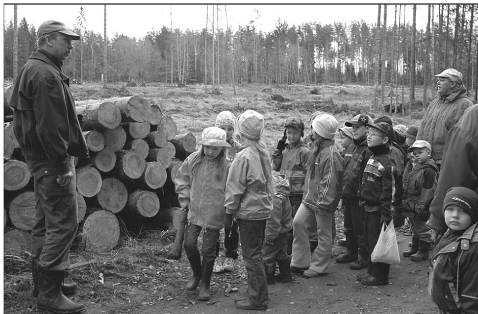
Ain Laanemetsatarkust jagamas