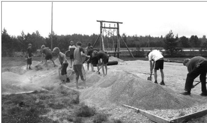
Töölaagris „Noortelt noortele“ osalejad ehitavad Kootsis korvpalliplatsi