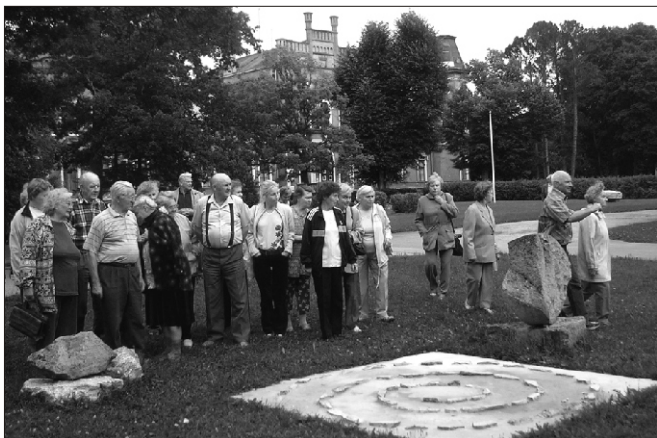
Reisiseltskond Porkunit uudistamas