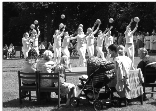
Esinevad võimlejad Tallinnast

Midagi jäi puudu ka. Lossiparki sobiks suursugune puhkpillimuu sika. Rohe-