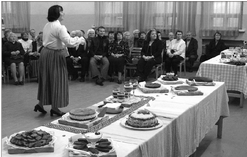
Esiplaanil Olustvere Teenindus- ja Maamajanduskooli õpilaste valmistatud leivatoidud