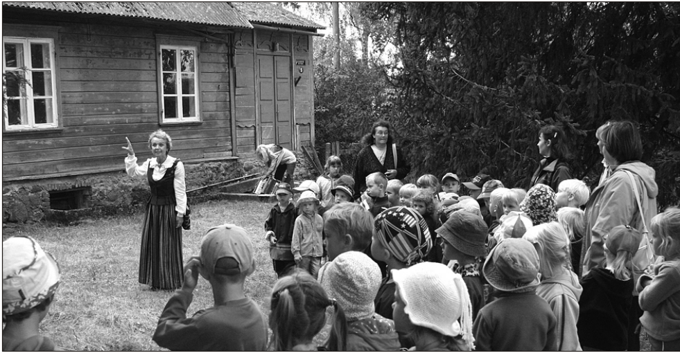
Lapsed vana lasteaiahoonet uudistamas...