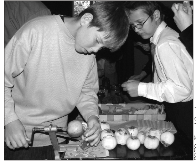
Poisid masinaga õunakoorigimist harjutamas.