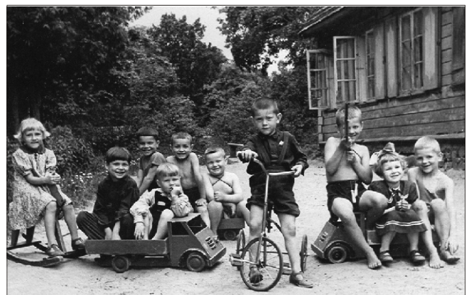
ja tänaste laste vanaisad-vanaemad või isegi vana-vanaemad ja -isad 55 aastat tagasi sama maja ees mängimas.