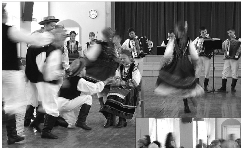
Poola laste naljatants

Viljandi VIII Talvine tantsupidu jõudis sel aastal ka Suure-Jaani.