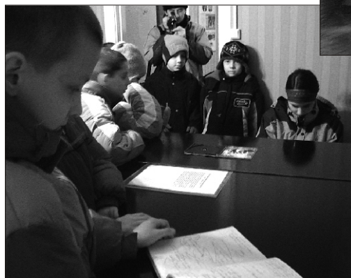
Tantsulapsed Kapi muuseumis musitseerimas

Olümpiamängude avamise päeva pärastlõunal esines Suure-Jaani Gümnaasiumis poola laste tantsu- ja lauluansambel "Podlasiacy". Poolakate lusti ja hoogsat tantsu ning kaudneid rahvarõivaid said näha ka Sürgavere ja Tääksi lapsed. Eesti rah-