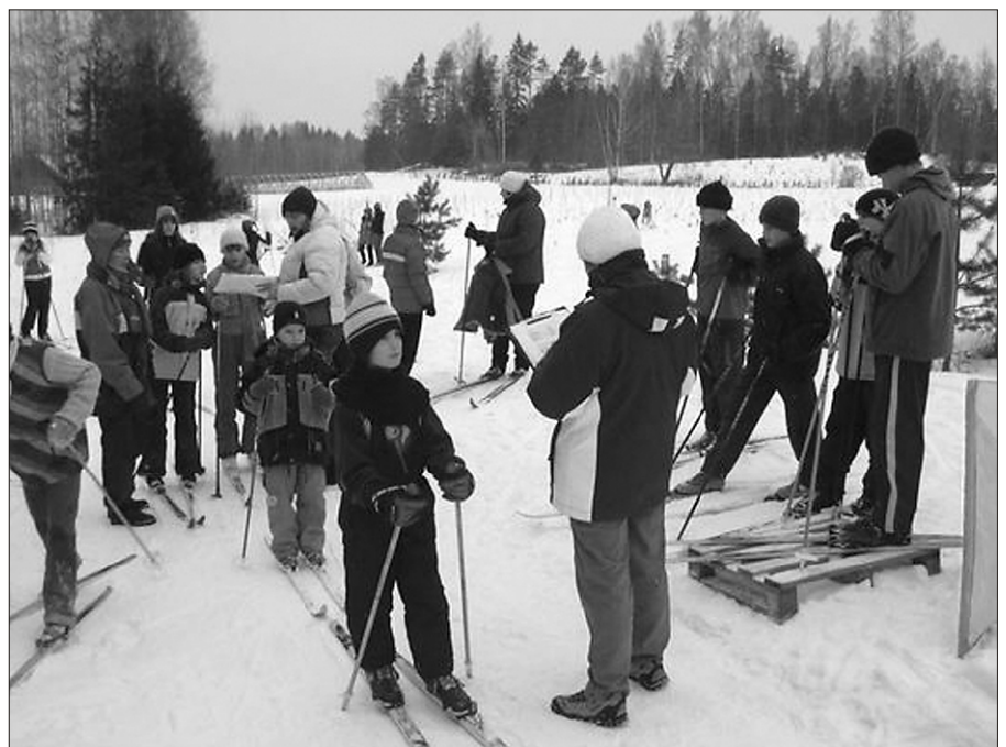
Stardis on kõige nooremad