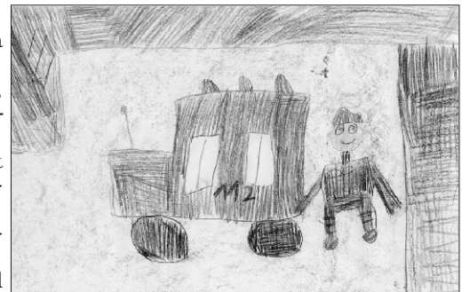
Sandri, 7 aastane