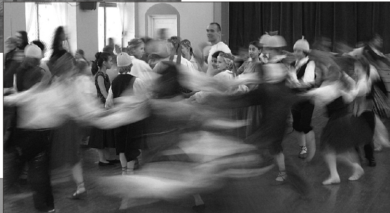
Ühine hoogne tantsukägar