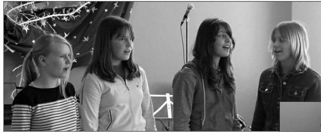
Kildu kooli laulutüdrukud