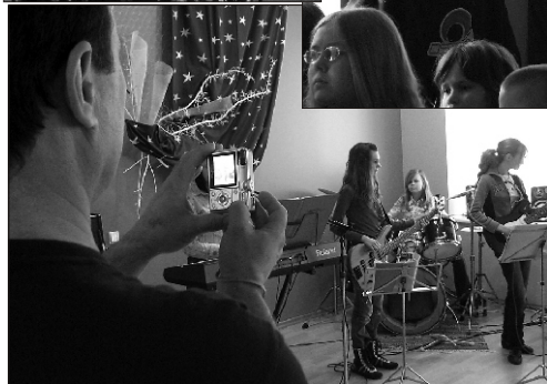
Olustvere bändi G4 tüdrukute kõige suuremad fännid on vist - isad. Aga tundub, et mitte ainukesed