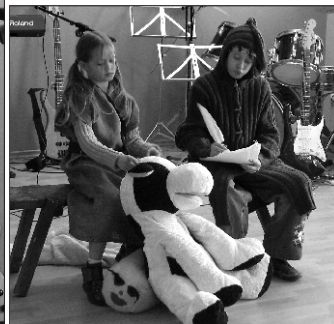
Anu Kivi näiteringi lapsed Suure-Jaanist