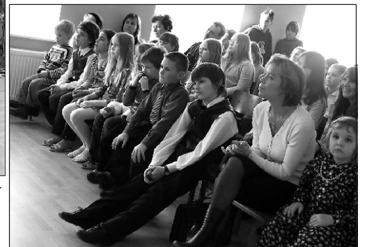
Rahvamaja saal mahutas vaeu kõik vaatajad