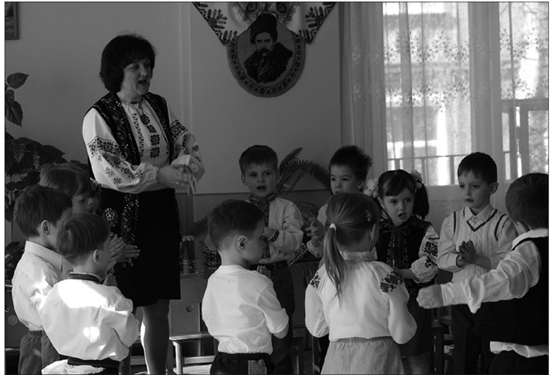
Väikesed esinejad lasteaias