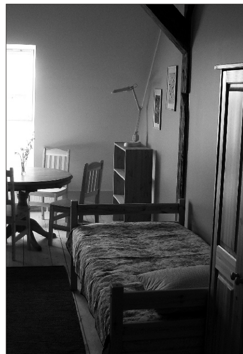
Nurgake õpilaskodus