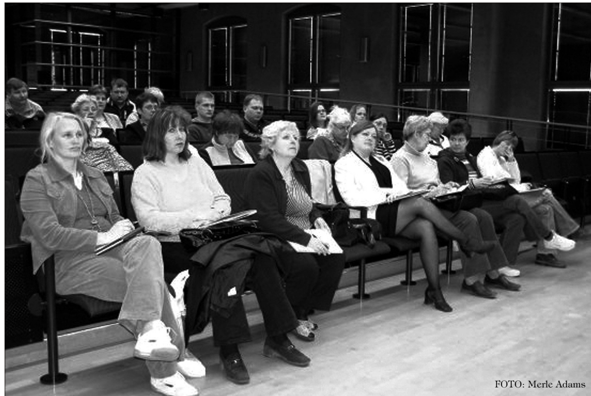
Reisiseltskond kuulab soomlaste juttu projektidest ja koostööst.