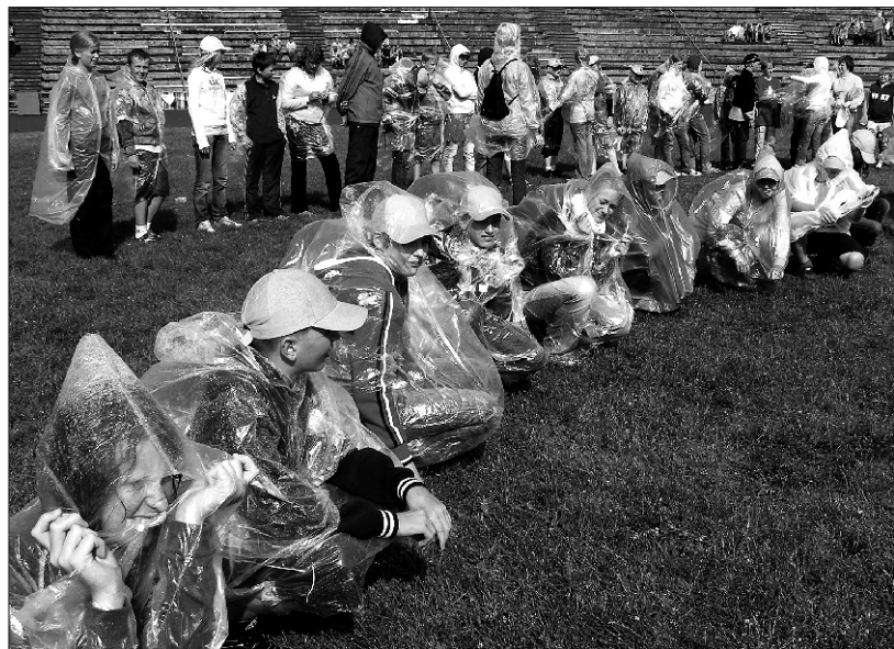
Tantsupeoline trotsib nii vihma kui päikest