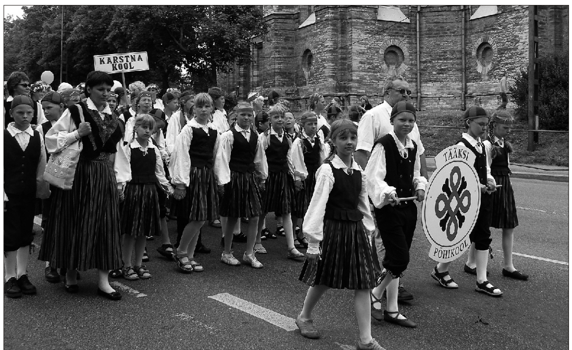
Täaksi lapsed rongkäigus