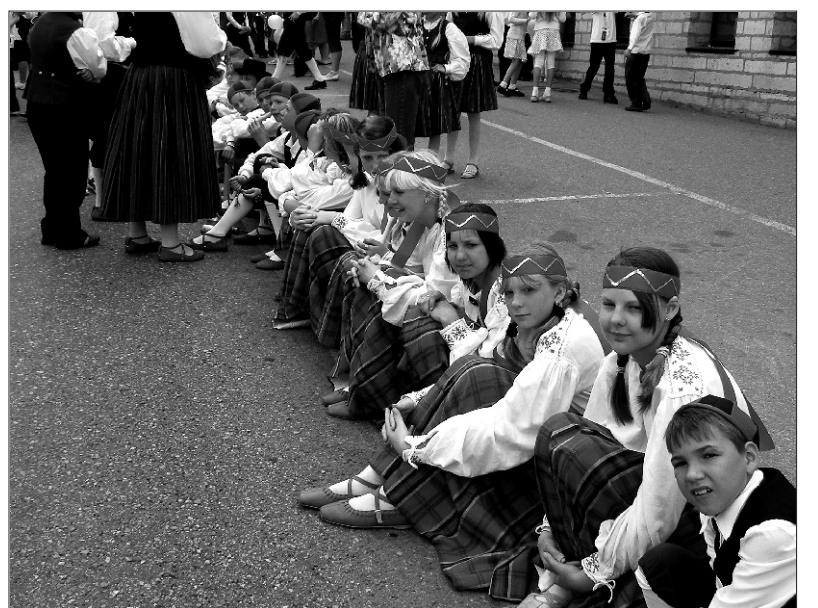
Rongkäigu ootel &gt;