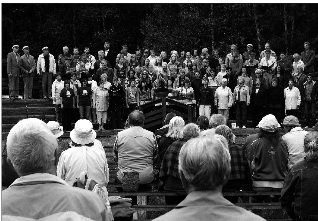
Ühendkoor Hüpassaare laululaval. Esimest korda on maakonna kooride sügispäeval ka lastekooride lauljad.

28. septembril möödus 125 aastat helilooja Mart Saare sünnist.