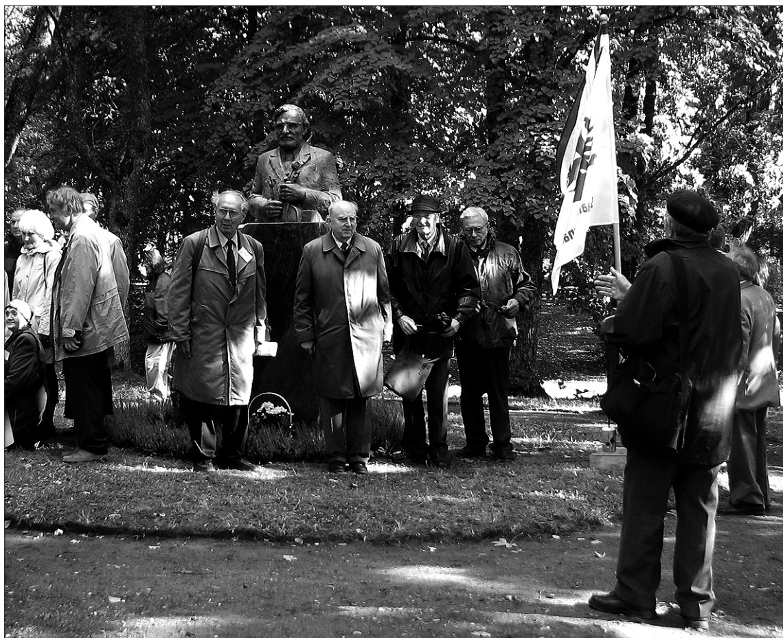
Suure-Jaani Gümnaasiumi vilistlaste kokkutulekul osalejad Kondase mälestustähise juures grupipilt teemas.