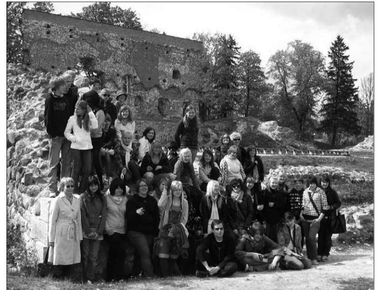
Külalistega Viljandi lossimägedes.