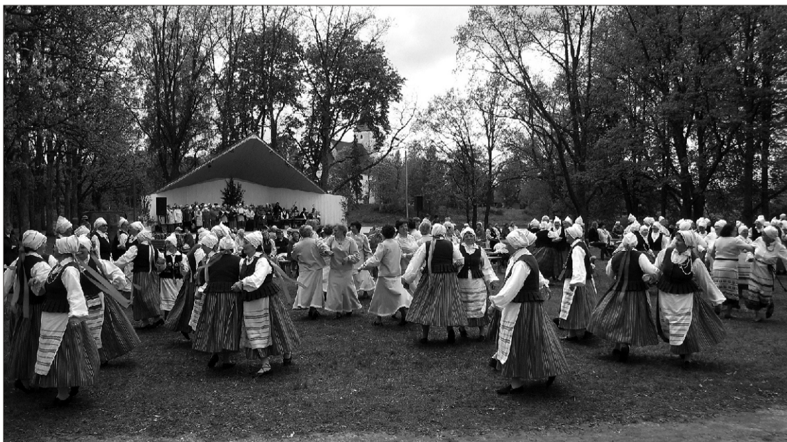
Tantsijad täitsid kogu lauluväljaku muru.