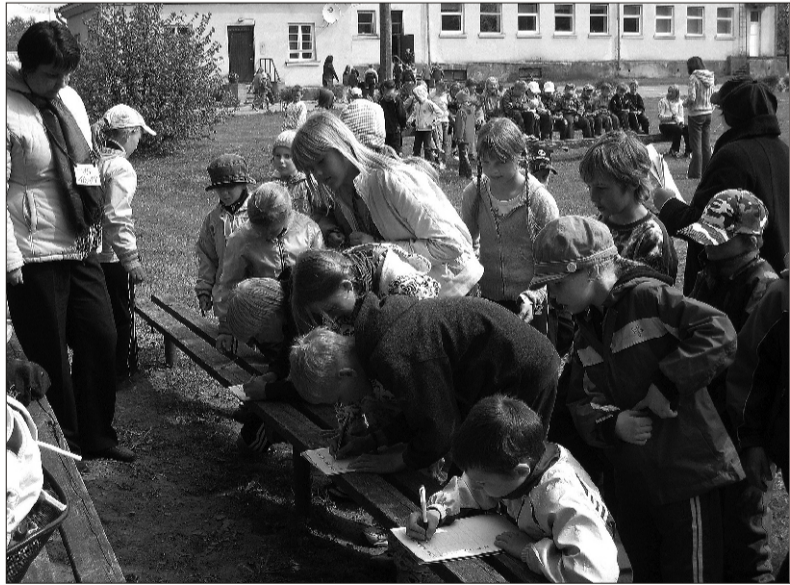
Kondase pargis jätkus kõigile tegevust