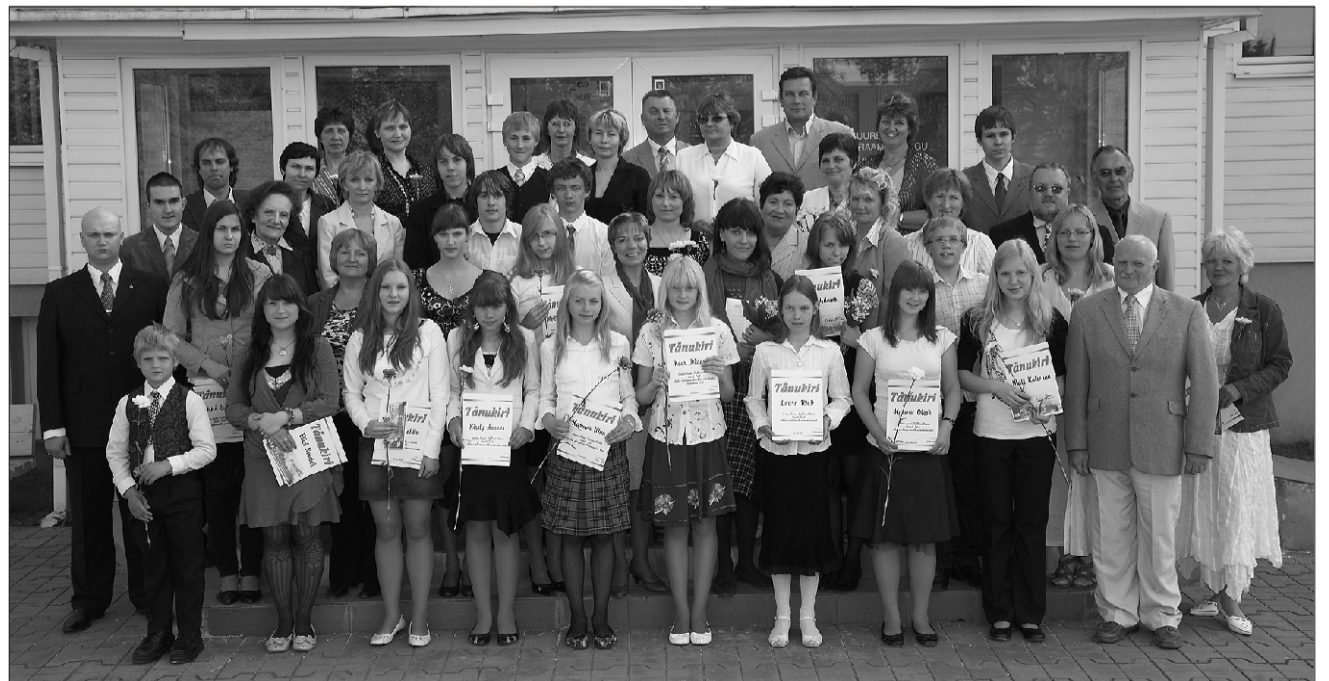
Suure-Jaani vallavanem võttis 26. mail vastu valla koolide tublisid õpilasi - kes saavutanud häid kohti olümpiaadidel ja konkurssidel - nende vanemaid ja õpetajaid.