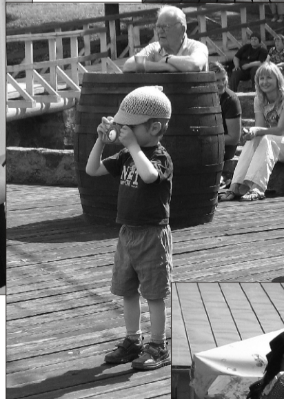
Vabalava väike foto- > graaf

Kõige väiksemad < lauljad-tantsijad valla lasteaiadest