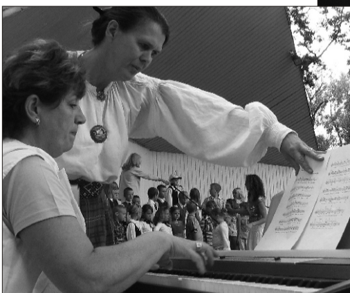
Proove tegid ka koorid >>

Et pidu õnnestuks, alustasid tantsijad > proovidega juba hommikul. Lavastaja Tiit Siim