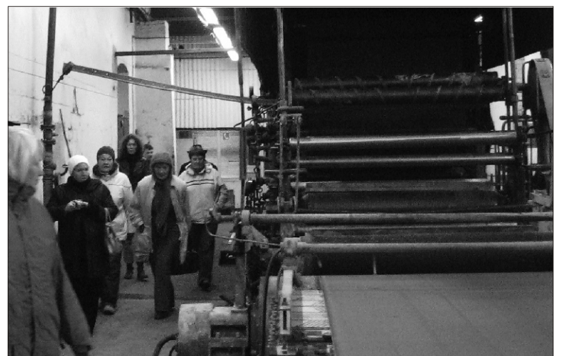
Paberivalmistamise masinat uuendamas