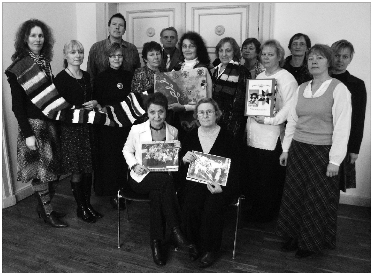
Projektis Kasvame koos Eestiga osalenud Suure-Jaani valla koolide ja lasteaedade esindajad (pildil puuduvad Kildu Põhikooli esindajad)