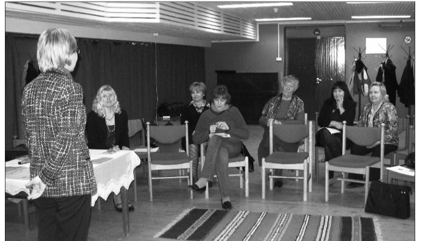
Hetk kolmandalt Arengupäeval