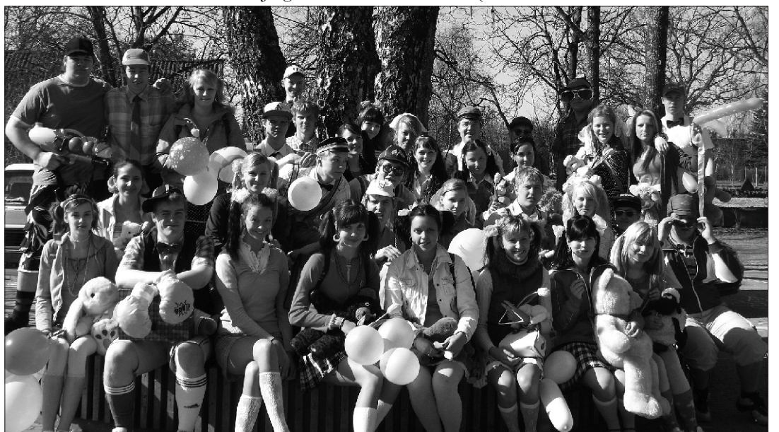
Tutipäev - Suure-Jaani Gümnaasiumi LXI lend