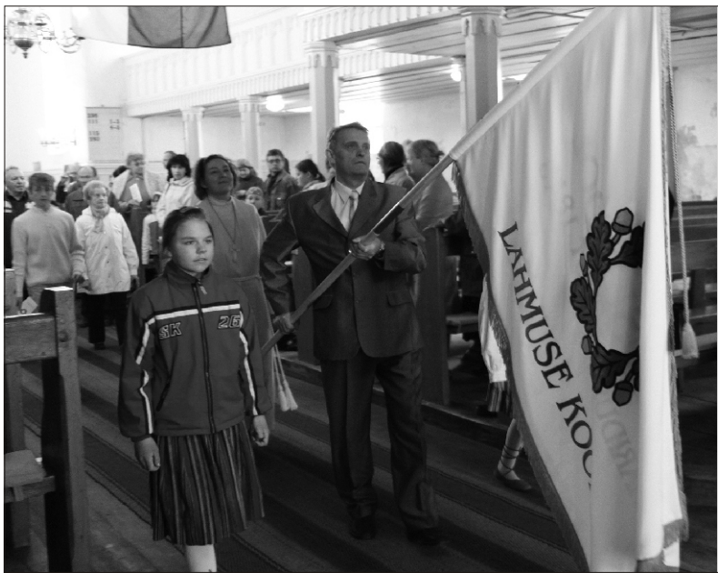
25. aprillil tähistati Lahmuse hariduselu 160. aastapäeva. Päev algas kooli lipu pühitsemisega Suure-Jaani kirikus.