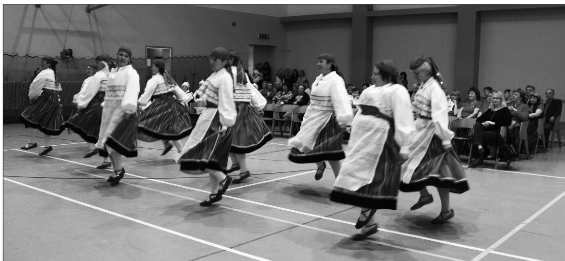
25. aprillil pidasid Sürgavere tantsunaised oma 40. sünnipäeva

13.06 - Orienteerumisvõistlus „Kootsi küla kaardile” algusega kell 12 Kootsi küla väljakult