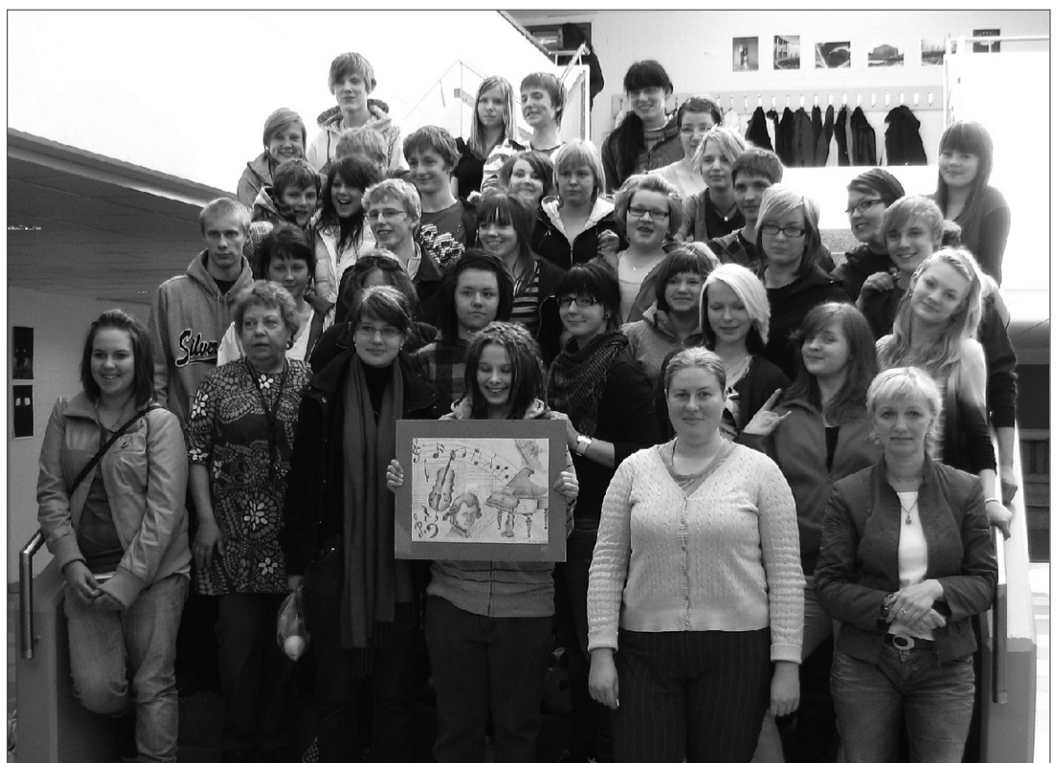
Reisiseltskond enne Ulvilast lahkumist