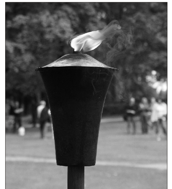
^ Sellest tulest süüdati järgmisel öhtul Suure-Jaani jaanituli