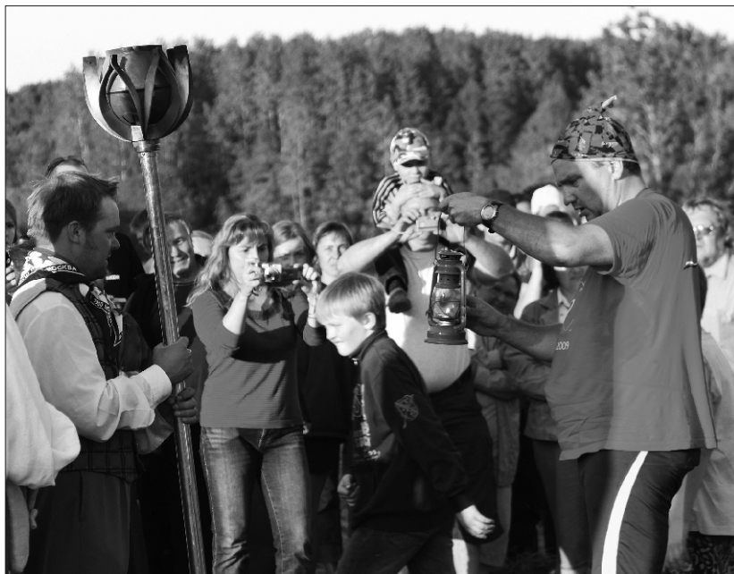
Sellises tormilaternas sõitis tuli haabjas

Öerutajatega sai lihtsamaid tantse kaasa tantsida