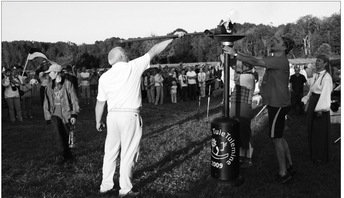
Kohe süttib laulupeotuli tulealuses