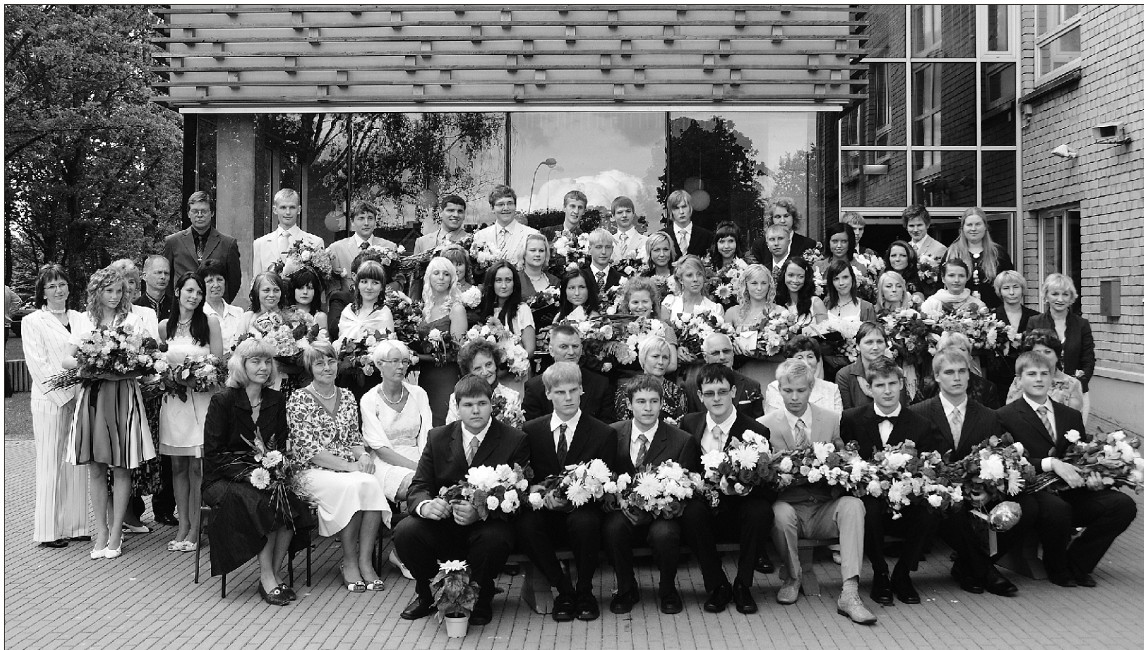
Suure-Jaani Gümnaasiumi lõpetanud ja õpetajad