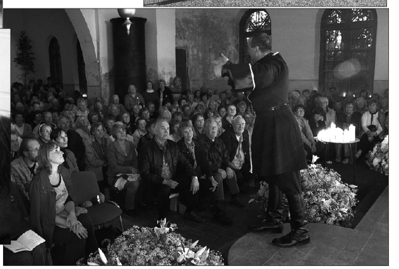
Kubani kasakad oskasid ka publiku kaasa laulma - või vähemalt ühisema - panna