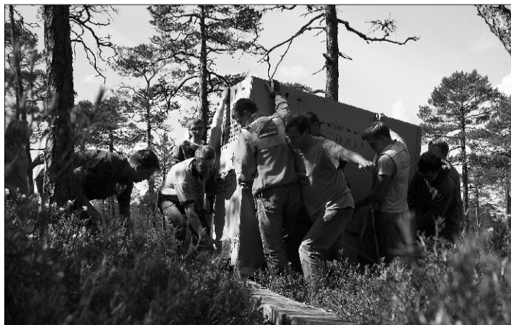
... aga täiendavaid hobujõude oli vaja ka klaveri õigesse mängupaika viimiseks