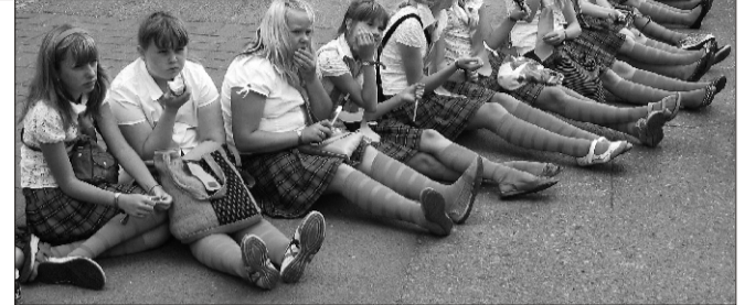
^ Suure-Jaani Gümnaasiumi lastekoori neid rongkäiguootuses v Killu tantsutüdrukud