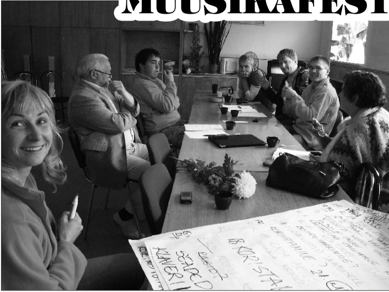
Hetk muusikafestivali korraldajate töökoosolekult