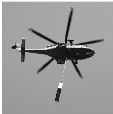
Nii ta rappa lennutati...

Kaheteistkümnendale Suure-Jaani Muusikafestivalile andis erilise näo konservatooriumi õige nimega Eesti Muusika- ja Teatriakadeemia, mis neiks juunipäevadeks 65 aasta tagust ajalugu meenutamaks - ja oma 90. sünnipäeva tähistamiseks - Suure-