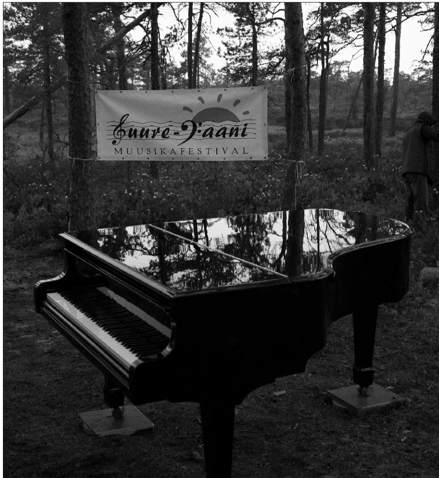
Estonia tiibklaver - üks selle festivali „tähtedest“ - rabasaarel