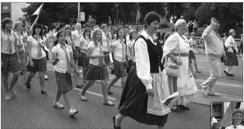
Suure-Jaani Gümnaasiumi lastekoor