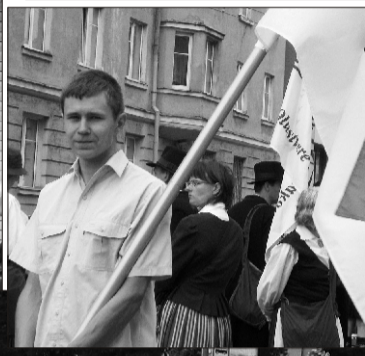
^ Olustvere Põhikooli noored lauljad rongkäiku ootamas < Suure-Jaani Gümnaasiumi lipukandja