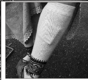
Kas seda tähendabki ütlemine „raha sukasäärde panema”?