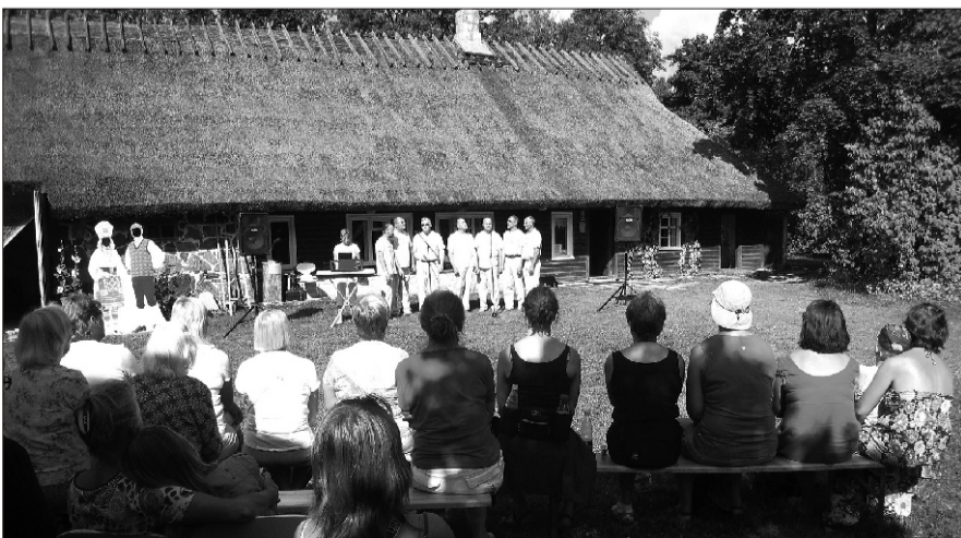
Suvel toimuvad Koguväe Muuseumis igal nädalavahetusel kontserdid, kus astuvad üles esinejad oma maakonnast ja kaugemaltki. Augusti algul laulis muuseumi külalistele Vastemõisa meesansambel Pange Poisid.

02. oktoober Eesti meistrivõistlused jalgpallis B2 vanuseklassis SK Tääksi - FC Elva Suure-Jaani Gümnaasiumi staadionil algusega kell 17.