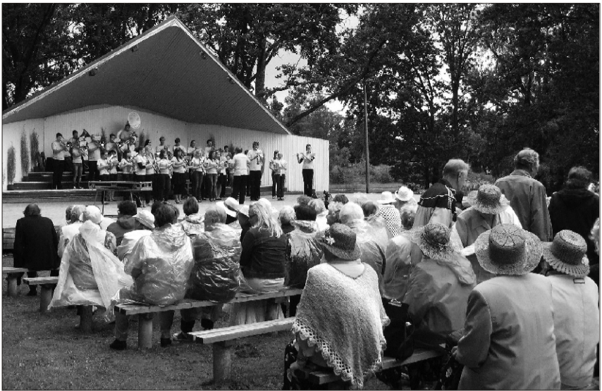
Rukkimaarjapäevalised trotsisid nii vihma, tuult kui päikest. Laval on Wersalinka.