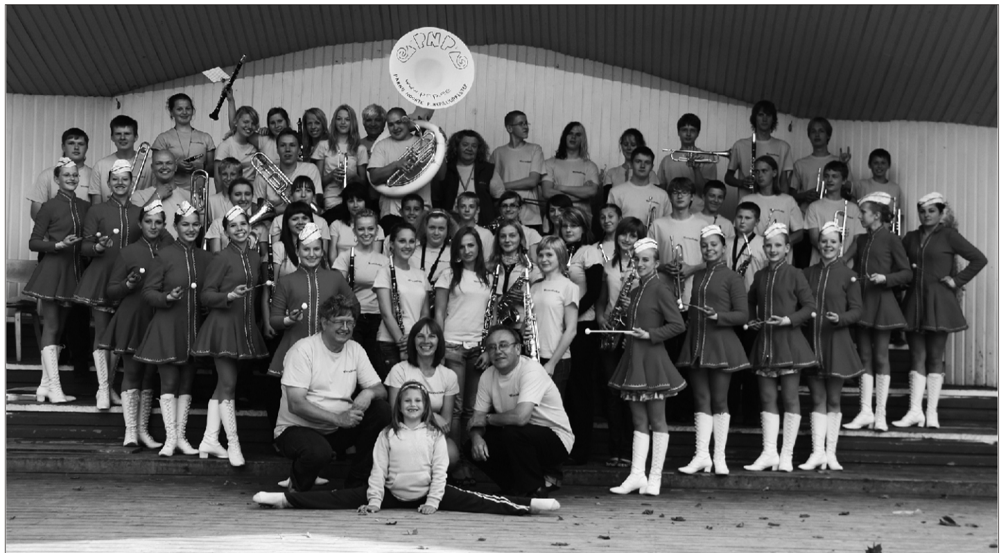
Wersalinka 2009 pere Suure-Jaani laululaval