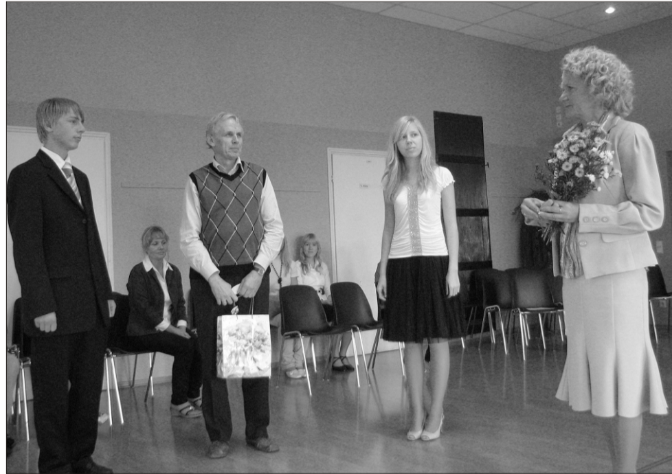
Õpetajate päeva aktus Kildu koolis

Mina andsin tunde 3. ja 6. klassile ning ka õpetajatele. Püüe 6. klassis õpiku vastu huvi tekitada oli üsna lootusetu, seepärast tegin pakkumise hakata hoopis mängima - see sobis neile väga hästi. 3. klass oli väga osavõtlik, kuid tekitas liiga palju nalja ja asi läks üle käte. Andsin tundi ka õpetajatele.