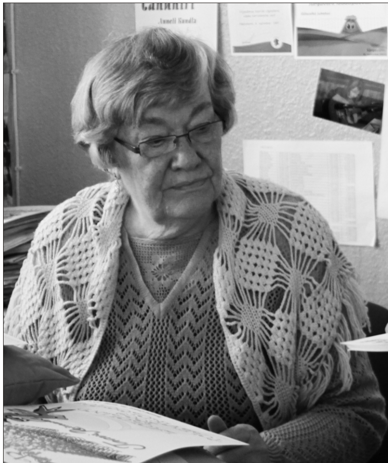
2009. aasta aprillis - Endla on tulnud appi laulukonkursi Laululind diplomeid kirjutama