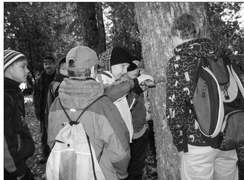
Poisid puud mõõtmast

Õpetaja Urve Siimsoo on aastaid valmistanud ette õpilasi 6. klasside maakondlikuks õpiokuste olümpiaadiks . Kooli esindanud Annika Saar, Mailiis