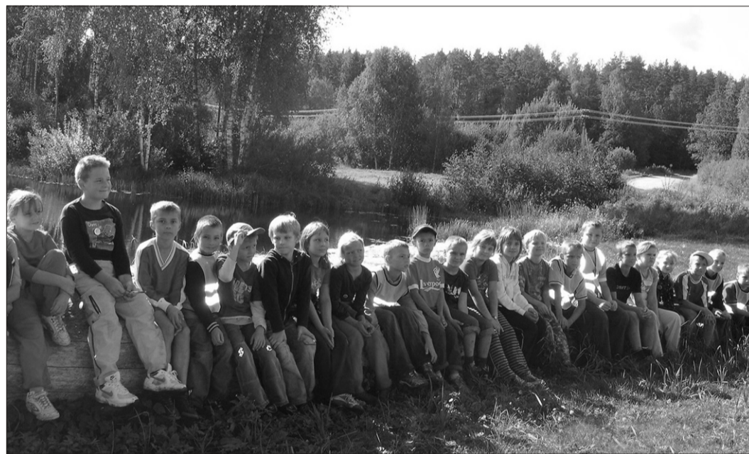
Tääksi kooli lapsed looduses