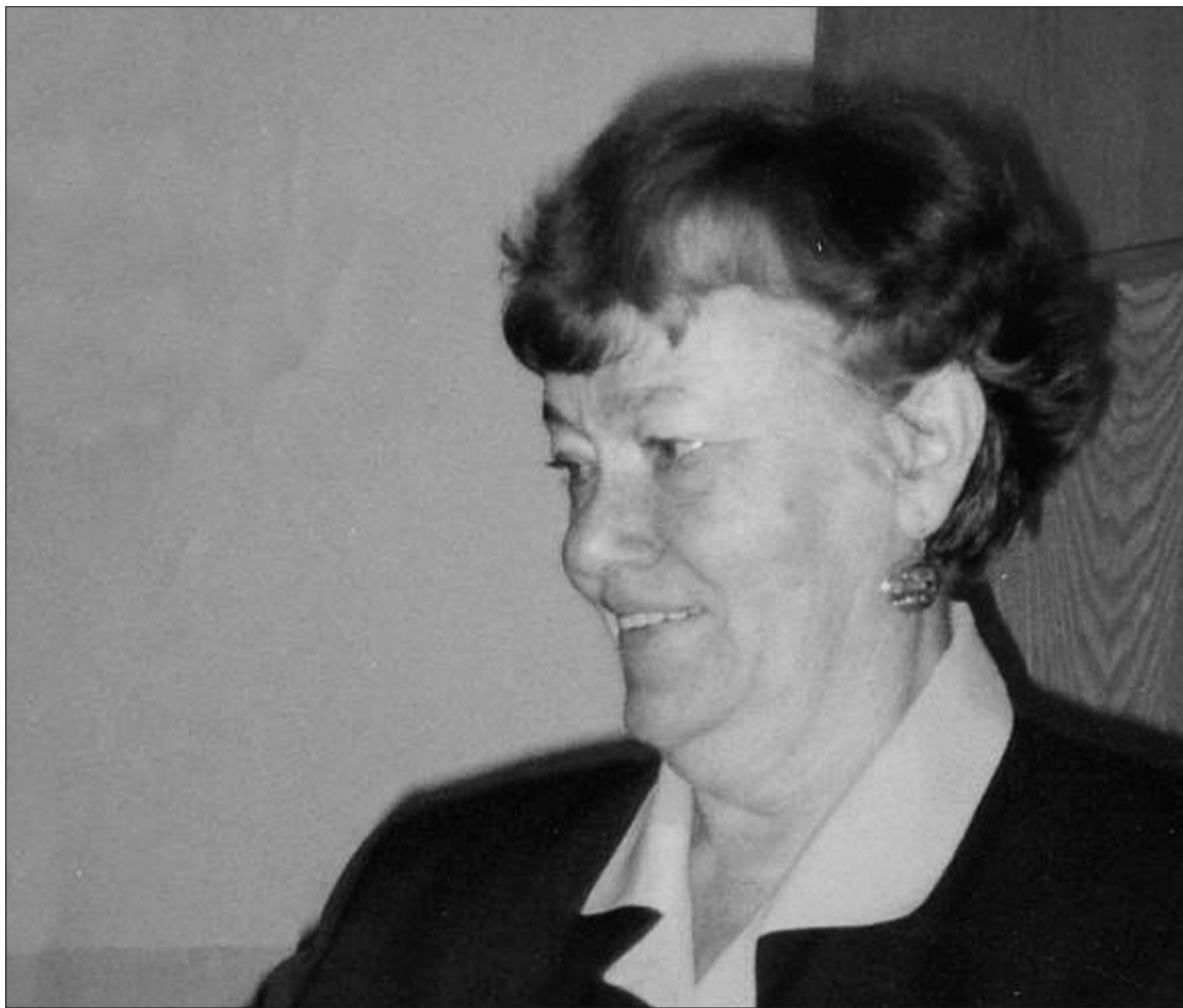
Endla aastal 1998