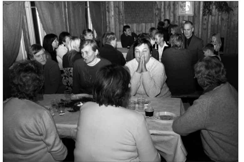
Üldekate Tegijate Öhtu