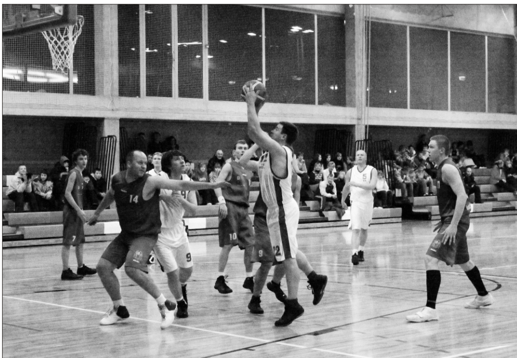
Palli saadab korvi poole Jüri Ratas