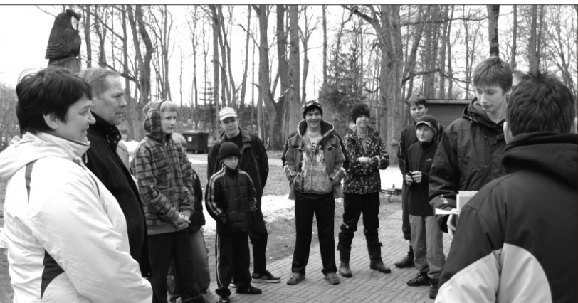
Osalejad instruksiooni kuulamas

Esimeses kontrollpunktis said võistkonnad, kes koosnesid kahest koolilapsest ja ühest valla ametnikust, enda valdusse ühe jalgratta, mis oli abimeheks edasiliikumisel järgnevatesse punktidesse. Lisaks veel ülesande leida täpselt 1 kg kaaluv kivi, mis tuli finišisse jõudes kaalukaussile asetada.