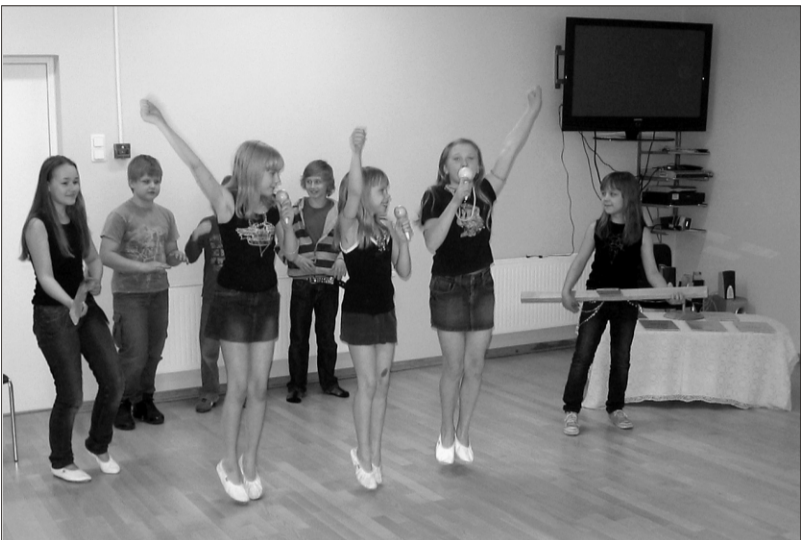
4. klass oma võidulugu esitamas