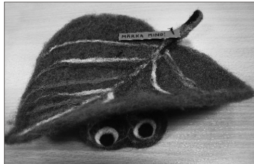
Valve Lindla "Märka mind"