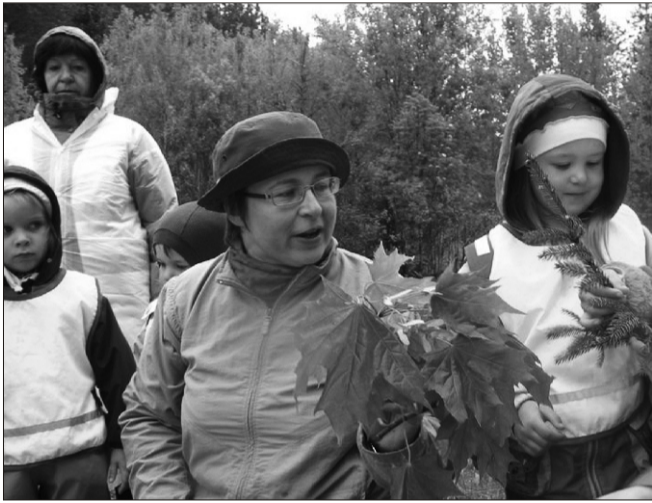
Pille ja sipsikud