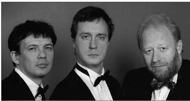
Kolm vene basso profundo

Suure-Jaani Ristija Johannese kirikus saab kuulata Tallinna Kammerorkestrit, meditatsioonikontserti löökpillidel ja Jaanijazz'i.