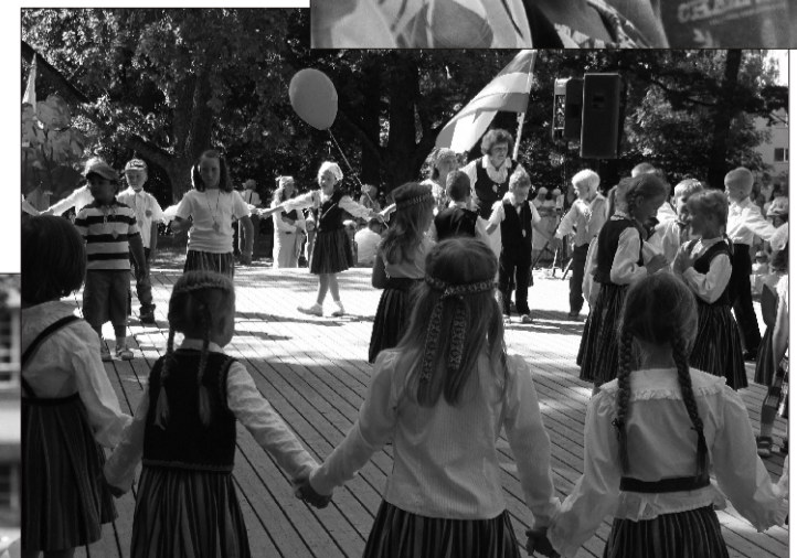
⋈ Kõige rohkem uut ja huvitavat kogesid kindlasti lasteaialapsed, kelledest paljudele oli see pidu esimene laulu- ja tantsupidu, kus nad osalesid