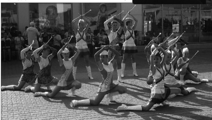
Suure-Jaani > kontserdil tibutas vihma ja mažoretide etteastet tuli libedaks muutunud lavalt murule tuua