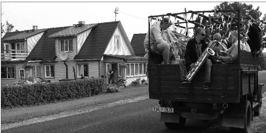
Järvepeo hommikused äratusmängud osutusid nii menukateks, et plaanilistele kohtadele lisaks tuli Puhkpillil Tallinna tänaval „soovikontsert“ anda.