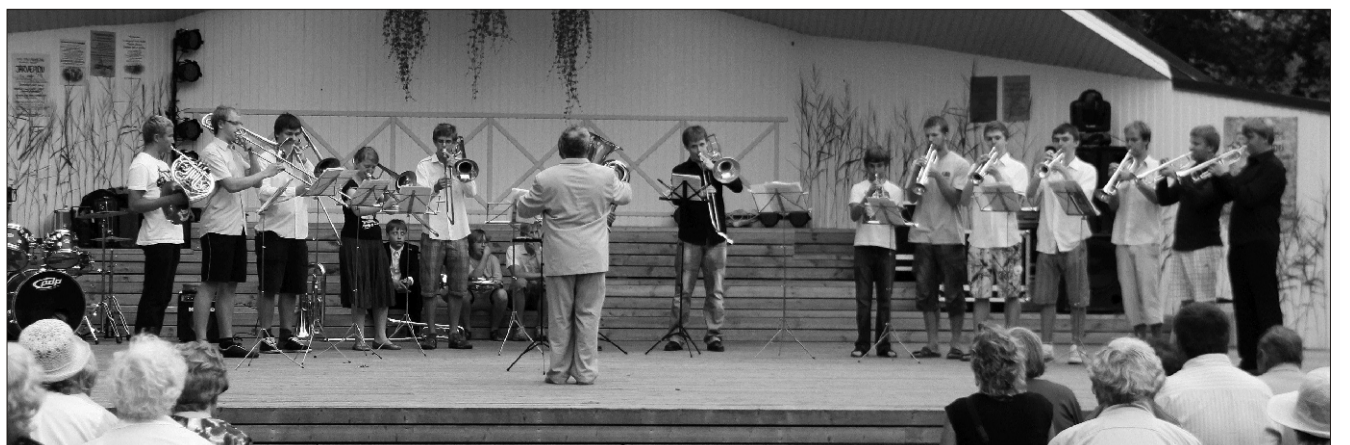
Osa Trompeti Suveakadeemia liikmeid Järvepeo laval