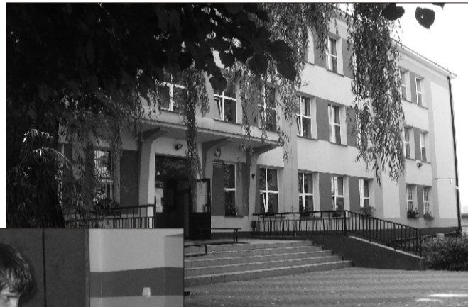
Wasilkowi gümnaasium - Wersalinka 2010 kodu