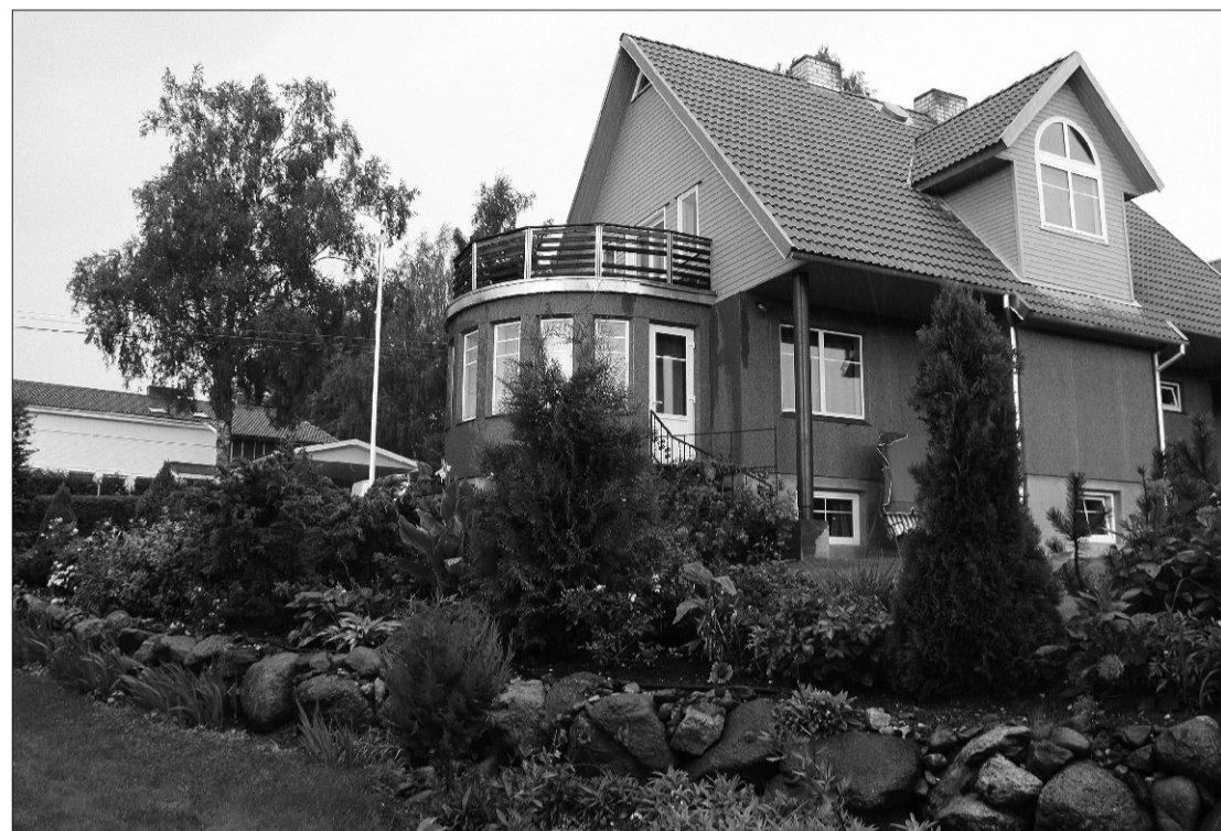
◀ Ringpuiestee 16A