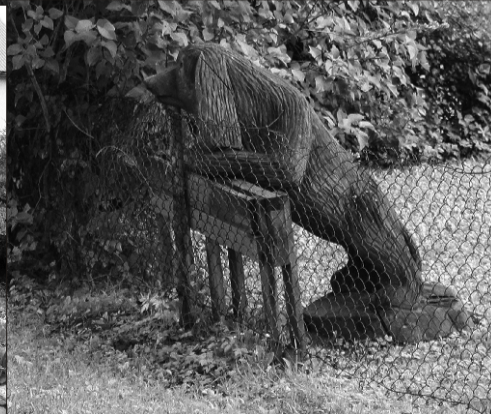
◊ Detailid Jaama tänav 9 eramu juures