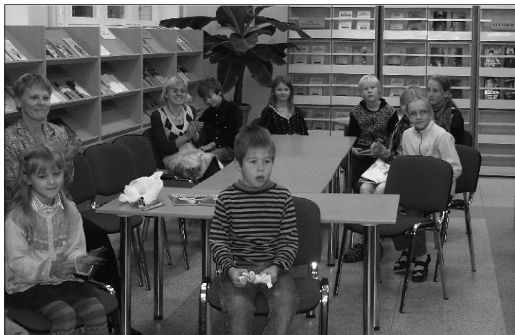
Olustvere raamatukogus toimus 21. oktoobril ettelugemispäev. Olustvere Põhikooli V klassi õpilased lugesid luuletusi TEA lasteluule varalackast ja I klassi õpilased etendasid näpunukkudega sõnamängu

1. novembrist 2010 alustas samasuguste teenuste pakkumist ka Tääksi raamatukogu - Eesti Post sulges Tääksi Postkontori.