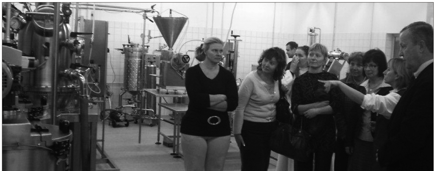
Huvilised Olustvere joogitööstust uudistamas