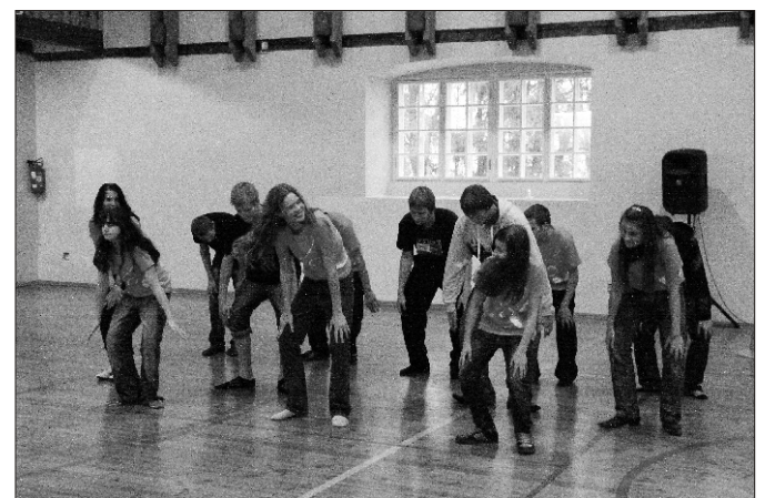
Tantsunumber Lahmuse Kooli õpilastelt