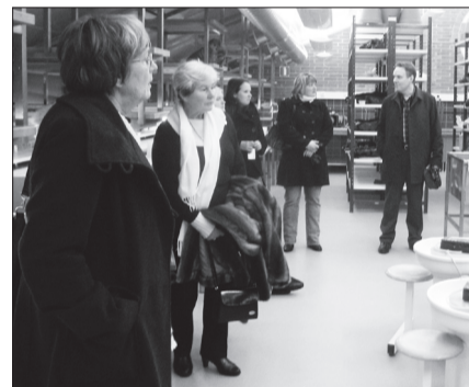
Keraamikaklass Forssa kunstikoolis