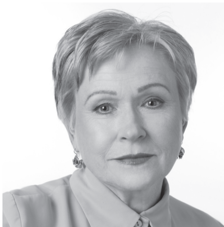
nr 676 ÜLLE LUMI

Riigikogu väliskomisjoni aseesimees, Keskerakonna aseesimees