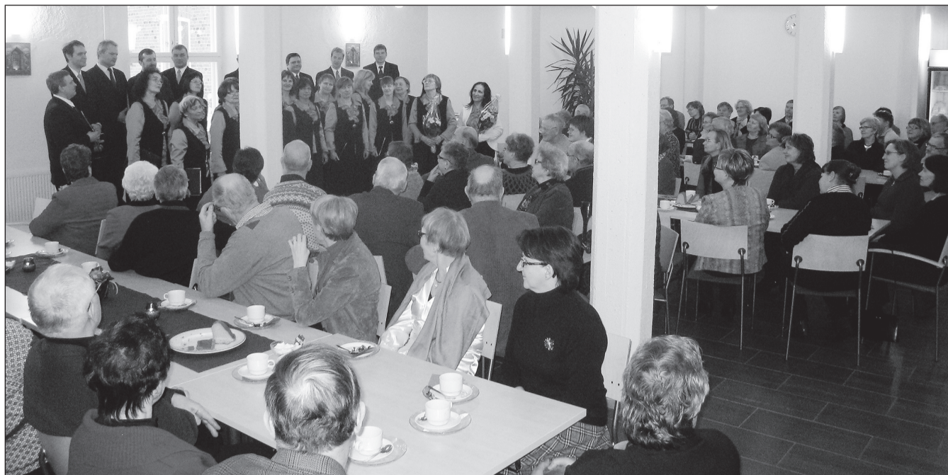
Lehola kontsert Jokioise Tietotalos.