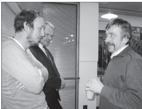
Uudistama on tulnud ka endised omakandi mehed