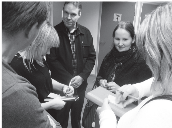
Jokioise ja Suure-Jaani valla noorsootöötajad kontakte vahetamas – koostöö võib jätkuda.