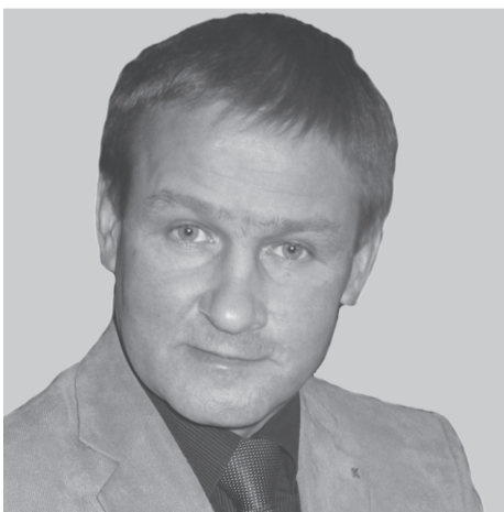
nr 682 JAAK AAB

Riigikogu liige, endine sotsiaalminister