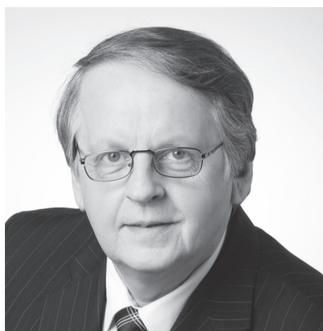
nr 673 ENN EESMAA

Riigikogu väliskomisjoni aseesimees, Keskerakonna aseesimees