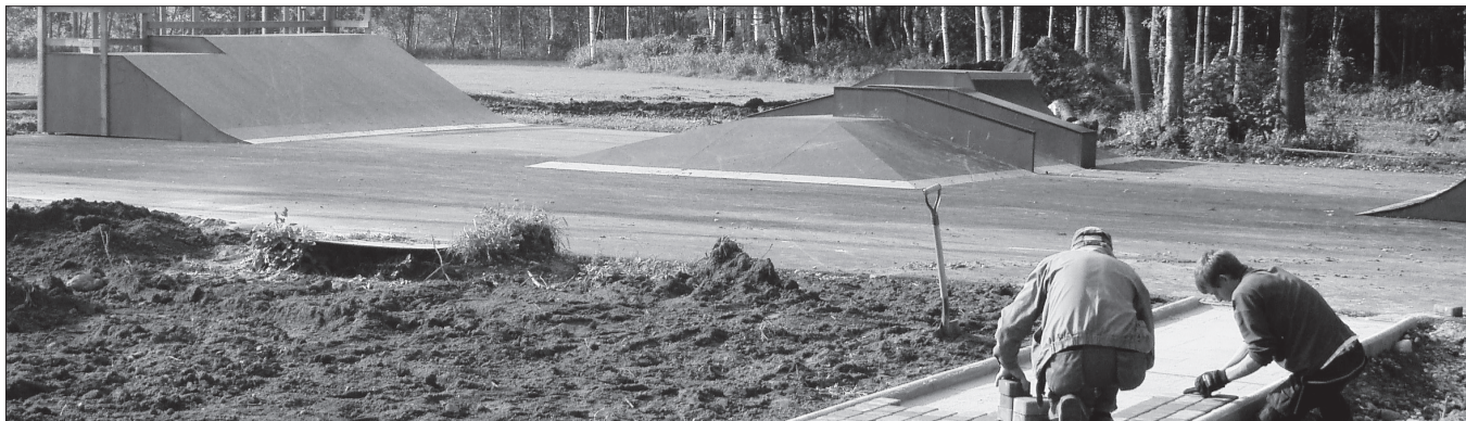
Uus kõnnitee viib noorte skateparki.

Kuigi valla spordieelarvet mõeldud aastal kärbiti, ei jäänud sportlikud saavutused varasematele alla. Raskuste kiuste võime rõõmustada ka uute spordirajatiste üle. Tääksi suusakeskuse hoonel valmimine avardas kõigi vallaelanike sportimisvõimalusi. Suure-Jaani kultuurimaja juurde rajatud väikeste muusikasõprade mänguväljak ja uus külakiik pakuvad lusti kõigile mängusõpradele. Kobruvere parki rajati uus rannavõlväljak. Suure-Jaani Noortekeskuse/Huvikooli juurde vabaajaväljaku rajamise I etapi tööd on lõpetatud ja PRIA on eraldanud toetuse ka järgmise etapi töödeks. Sel aastal soovime leida rahastust Suure-Jaani järve ümber