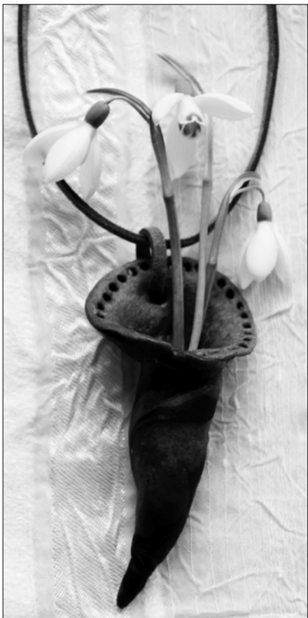
Kaelakee „Eluslilled kaela!“

Valituks sai ka batikatehnikas taimedega