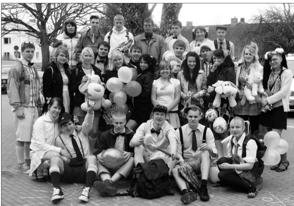
12. klass tutvapäeval.