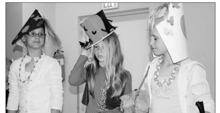
Selle aasta kübaramoed Sürgaveres.

Aasta teemaga seotud tegevuste käigus tekkis soov ise paberit valmistada, kuid vahendeid ja teadmisi selleks nappis. Raha paberi valmistamiseks vajaminevate töövahendite ja paberi valmistamise õpitoa läbiviimiseks, saime Hasartmängumaksu Nõukogult, kes rahastas Sürgavere lasteaiapõhikooli projekti „Teeme ise paberit“. Õppeaasta jooksul õppisid lapsed prügi sorteerima. Nii lapsed kui personal kasutasid igapäevast lastele ja lastevanematele, kui palju toodab inimene prügi ja kui mõtlematult viskame paberit prügikasti - kuigi on võimalik koguda vanapaberit ja suunata seda taaskasutusse.