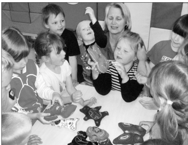
Vastemõisa lasteaia lapsed pihuloomadega.