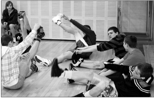
Võistkond soojendust tegemas.