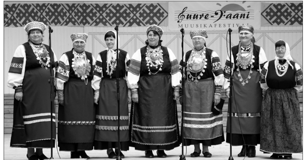
Kuldatsük laululaval