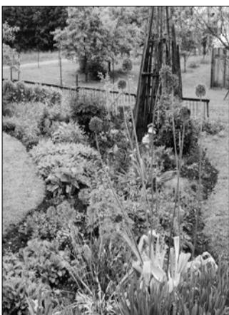
Kaunis lillepeenar Kallaku talu aias Võivaku külas