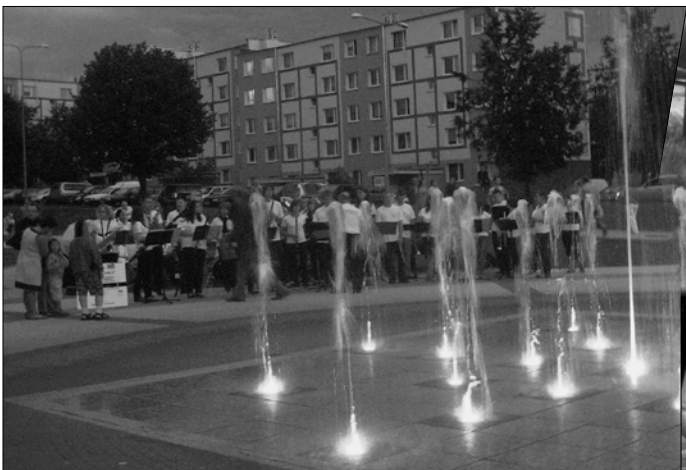
Esimene kontsert õhtuses Lomža uusrajoonis.