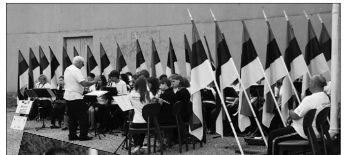
Wersalinka lipuehteis Sindi seltsimaja ees