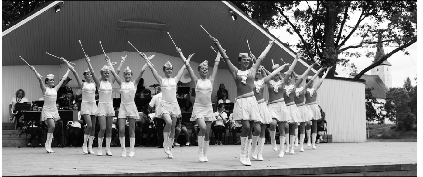
Wersalinka 2011 Suure-Jaani laululaval.