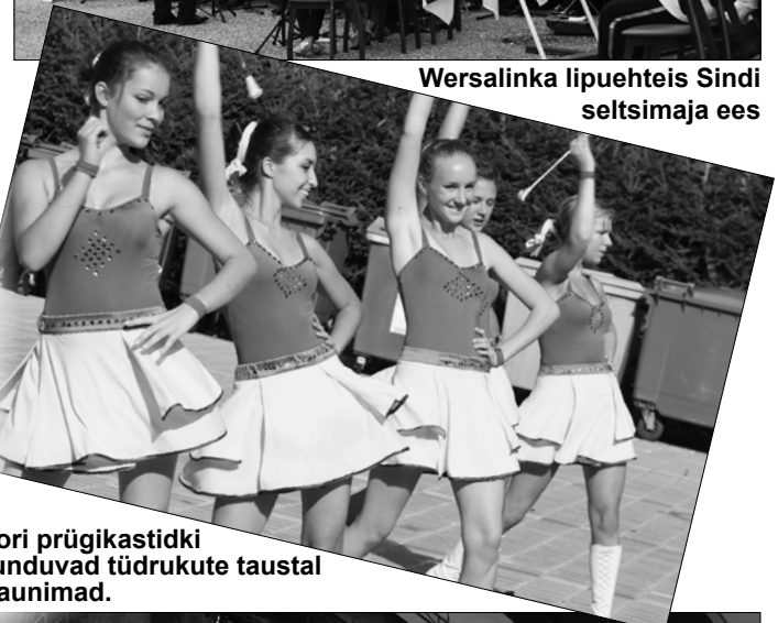
Tori prügikastidki tunduvad tüdrukute taustal kaunimad.