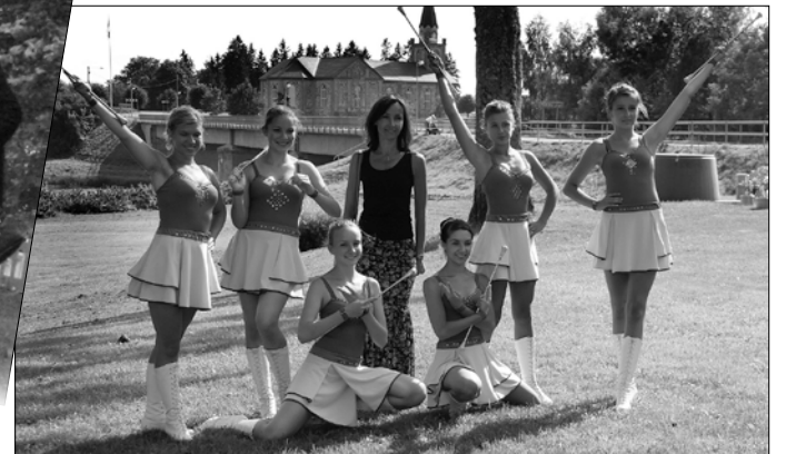
Lomžast pärit mažoretid, Marzanna, Tori põrgu ja Eesti sõjameeste mälestuskirik.