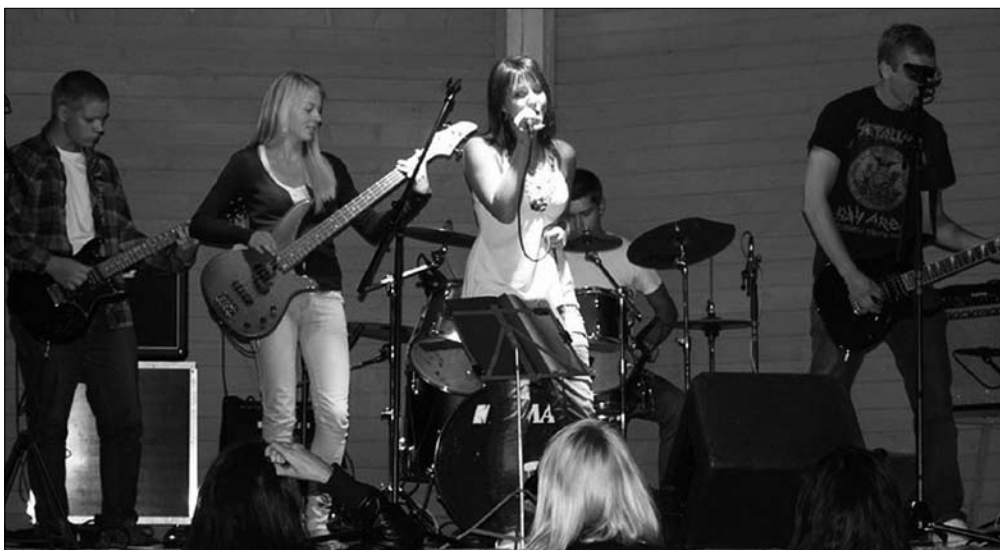
Suure-Jaani noortebänd Pure.

Bändide muusikastiilid olid üsnagi erinevad, loodetavasti leidis midagi igale maitsele. Õhtu alustas omanäoline To The Roots, kellele kohe fännid lava ette kaasa elama läksid. Teisena astus üles Mustla rokkbänd Penak. Nende laulja pidi küll haiguse tõttu puuduma, kuid head muusikat saime siiski kuulda. Hoopis teist sorti instrumentaalmuusikat esitas Olustvere bänd Swingers. Peale eelviimast, Suure-Jaani kaverbändi Pure, astus lavale Viljandimaa Noortebändide