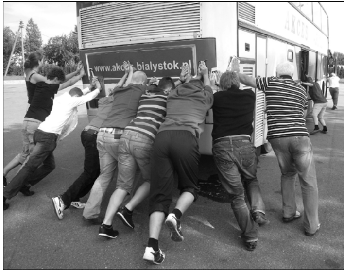
Poolast Valgevenesse ja sealt Eestisse – bussiga.