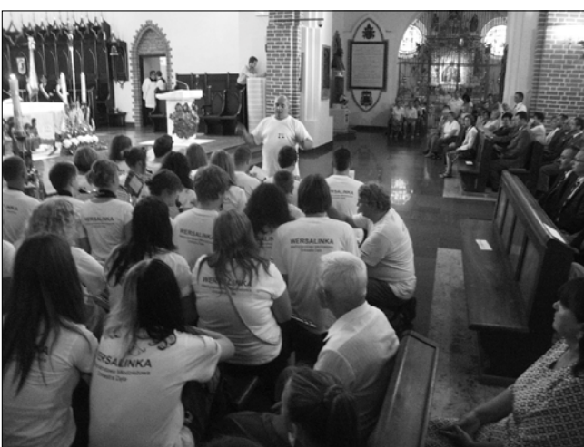
Poola Armeepäeval Lomža katedraalis.