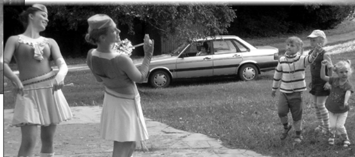
Mažoretid, „loožis“ istujad ja tulevased mažoretid.