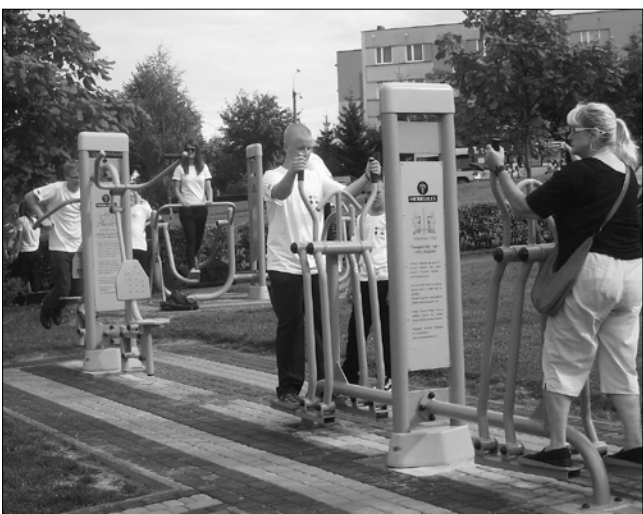
Lomža pargis, kus orkestril kontsert toimub, on rohkelt spordimasinaid ja neil palju uudistajaid – proovivad neist masinaist mõnda ka orkestri noored.