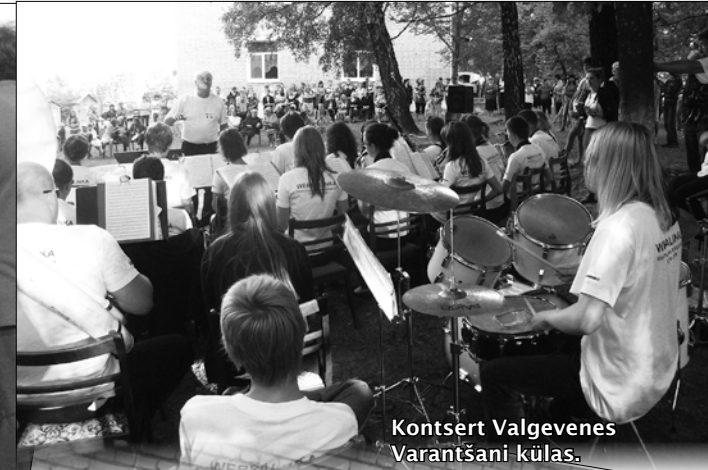
Kontsert Valgevenes Varantsani külas.