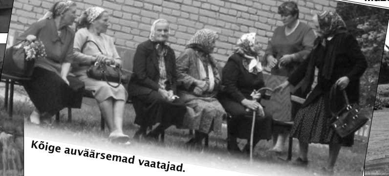
Kõige auväärsemad vaatajad.