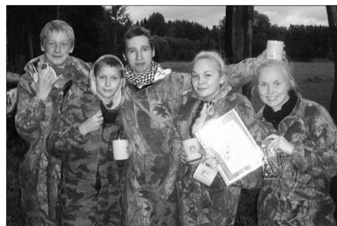
Paint-palliturniiri võitjad Vastemõisa noortekeskusest.

Paint-palliturniir on selle hooaja esimene noortekeskuste va-