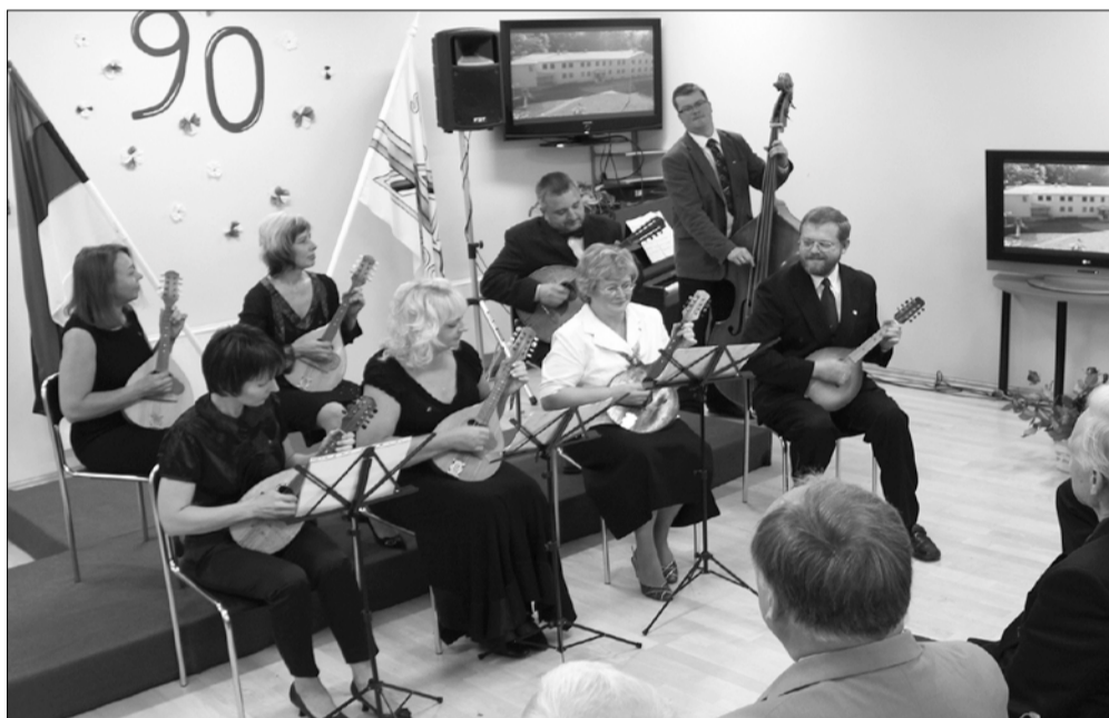
Siin ta on, Sürgavere koolile au ja kuulsust toonud mandoliiniorkester – vol. 2.

Hiljem jätkus pidu kultuurimajas, kus bändi saatel löödi tantsu varajaste hommikutundideni. Öhtu jooksul üllatasid kõiki Sürgavere kooli õpetajad, kes olid tähtsa päeva jaoks kokku pannud segarahvatantsurühma Helgi Linnase juhendamisel. Üles astus ka taasühinenud valgusteatr, kes koolis 1999. aastal tegutsema hakkas, kuid on tänaseks kahjuks laiali läinud. Peo jooksul leidis aset heategevuslik oksjon, mille tulu läks Sürgavere Põhikooli