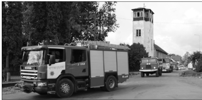
Päästetehnika kolonn lahkub Pärnu tänavalt.

9. septembril oli Suure-Jaanis tuletõrjepäev. Teiste ettevõtmete kõrval kolis kohalik päästekomando pidulikult Pärnu tänava kitsukestest ruumidest, kus kõige rohkem probleeme tekitas just tänapäevase päästeauto garaaži mittemahtumine ja raskendatud väljasoit, Oja tänaval asuvasse endise bussipargi renoveeritud ruumidesse. Ehitustööd finantseeris Suure-Jaani vallavalitsus, depoo sisustas Päästeamet. Lõuna-Eesti Päästkeskusele rendib ruume OÜ Balti Bussiremont.