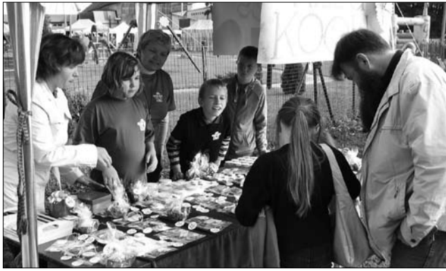
Kildu kooli lapsed ja õpetajad Vastemõisa laadal.