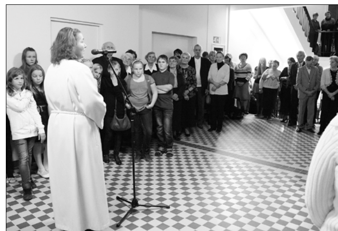
Enne saaliuste avamist jagus rahvast koolimaja mitmele korrusele.