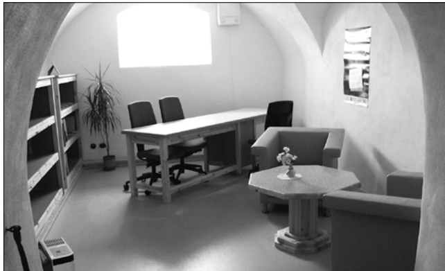
Õpilaskodu keldrikorrusel leiab ruume mitmeks otstarbeks.

30. septembril oli Lahmuse Koolis pidulik päev ja palju elevust. Seekord lõigati linti kolmel renoveeritud hoonel! Hiljaaegu olid valmis saanud õpilaskodu, toimetulekumaja ja käsitöömaja. Varem