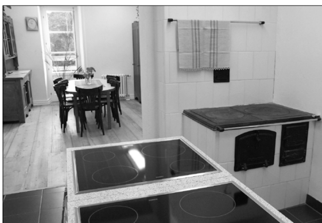
Käsitöömajas – endises juustumajas – on kõik vajalik söögitegemise õppimiseks.