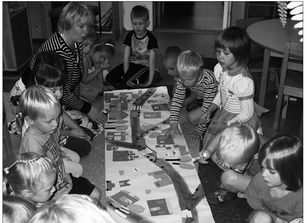
Ettevõtlusnädala ettevõtmise Suure-Jaani lasteaia Sipsis.