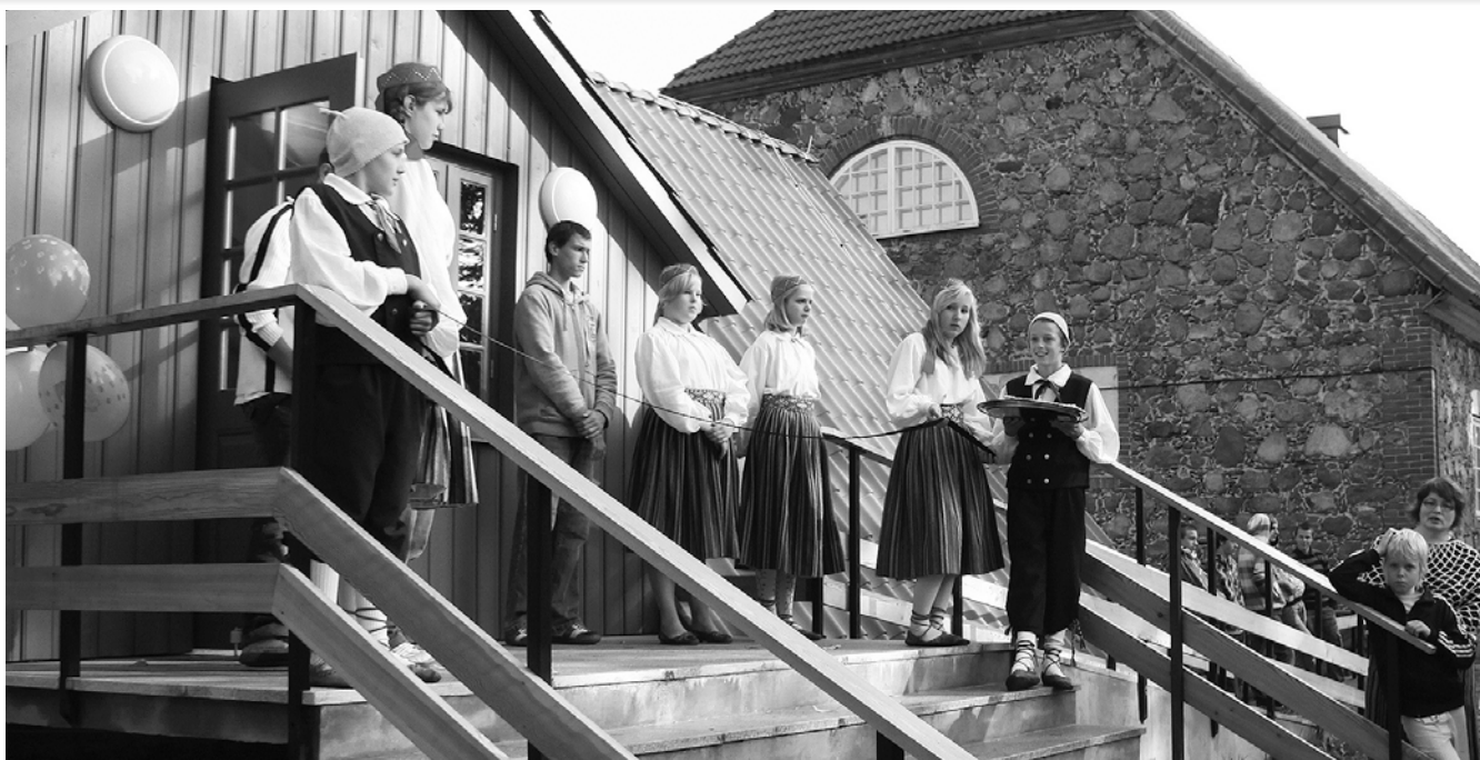
Toimetulekumaja – endine sepikoda – ootab lindilõikajaid.