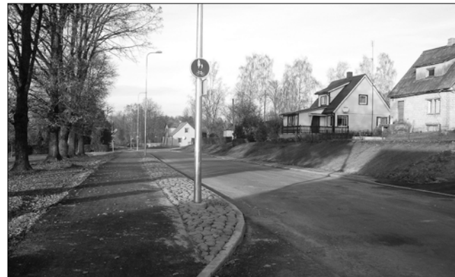
Kõleri tänav uues kuues.

Suure-Jaani Keskväljal mürtsus 10. novembril puhkpill. Suure-Jaani vald tähistas pidulikult Kõleri tänava rekonstrueerimise ning vee- ja kanalisatsioonitööde I ja II etapi valmimist. Kohal olid ja tänu pälvisid nii rahastajad kui tööde teostajad – kaunis päikeseline ilm oli välja meelitanud hulga huvilisi, kellele pakuti sooja teed ja kringlit.