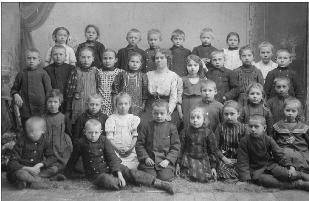
Foto tagaküljel on tekst „Suure-Jaani väikelaste kool 1909“. Kes annaks pildi kohta rohkem teavet?

Üks oluline daatum eesti kooli ajaloos on kindralkuberner George von