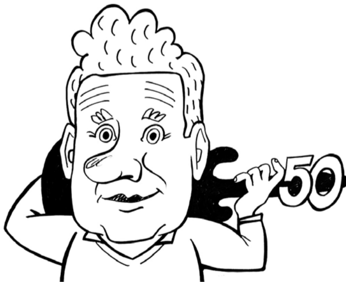
Autor Tõnu Kukku.

Juubilaril on teisigi huvialasid, talle meeldib no-kitseda endavalmistatud mööbli kallal ning silma