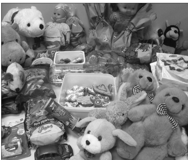
Osake õpilaste poolt kogutud piparkookidest ja mänguasjadest

Valla sotsiaalsakonna juhataja Aave Toomsalu ütles, et koolis kogutud piparkoogid ja mänguasjad läksid 16 vähekindlustatud pere laste kingikottidesse. Kokku sai sel moel jõulurõõmust osa 65 last. Veel lisas ta, et Suure-Jaani käsitööringi tublid naised Maive Ottase eestvedamisel olid samuti vähekindlustatud perede peale mõelnud ning 14 käsitöötajat kodus sokke, kindaid jm - kokku üle 50 eseme. Ka need asjad läksid jõulupakkidesse ning jõudsid jõuludeks valla vähekindlustatud peredeni.