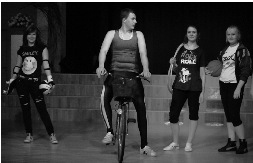
9. klassi moeshow.

Sportivallas toimus legendaarne torditurniir, kus vanemas arvestuses löi platsi puhaks 12. klass ning nooremas arvestuses 6. klass. Kohtunikud kiitsid mängijate viisakust ja head tehnikat. Samas võiks pealtvaatajaid järgmisel korral kindlasti rohkem olla. Ka õpetajad ja teised kaasõpilased võiksid tulla pallimängule kaasa elama. Sopsuvõistlusel oli