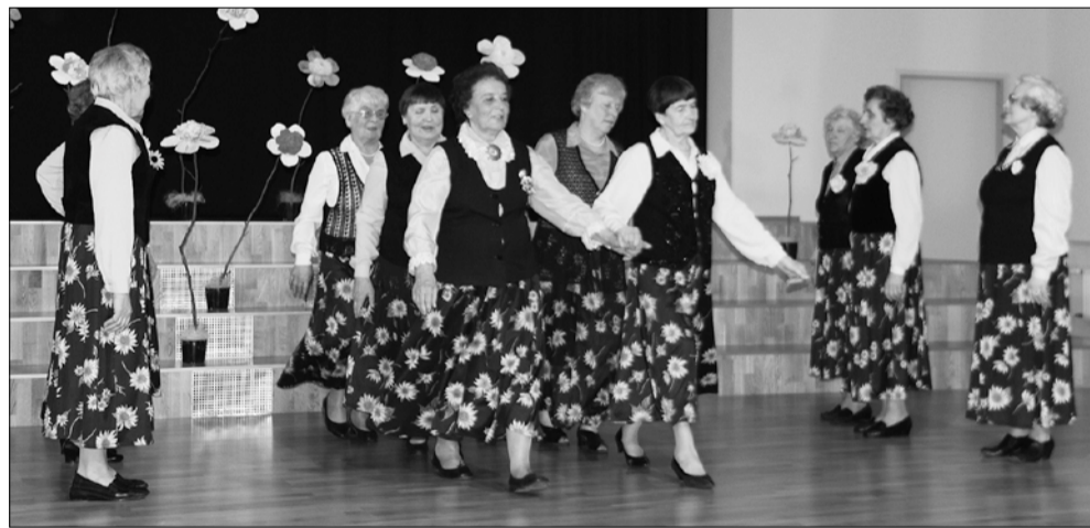
Publiku ees on Hilised Öied.

Esinetud on palju ja selleks oleme teinud ka tõhusaid trenne – õpitud tantsude nimekirja osutus päris pikaks. Iga esinemine pakkus suurt elevust. Kõik Lõuna-Eesti ja Viljandimaa memme-taadi peod on läbi käidud ja tantsitud. Lõbustatud on Meelespea klubi rahvast, Lõhavere hooldekodu elanikke; esine-