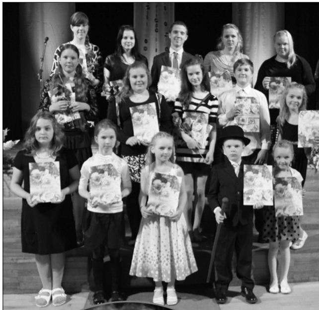
Nooruse Laul 2012 parimad.